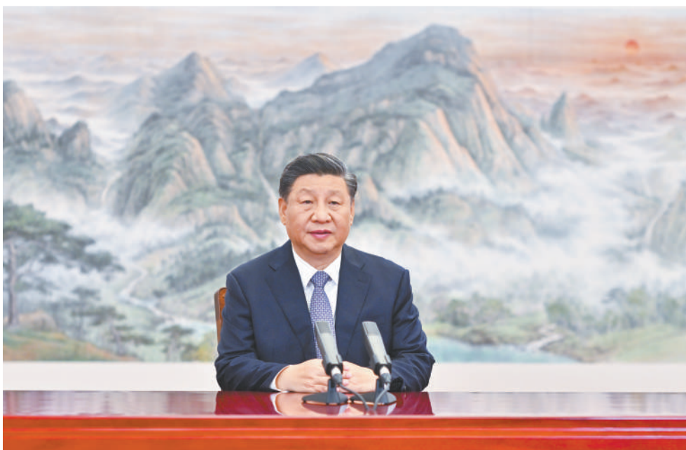
11月11日,国家主席习近平应邀在北京以视频方式向亚太经合组织工商领导人峰会发表题为《坚持可持续发展 共建亚太命运共同体》的主旨演讲。

新华社北京11月11日电 11月11日,国家主席习近平应邀在北京以视频方式向亚太经合组织工商领导人峰会发表题为《坚持可持续发展 共建亚太命运共同体》的主旨演讲。(演讲全文见第二版)