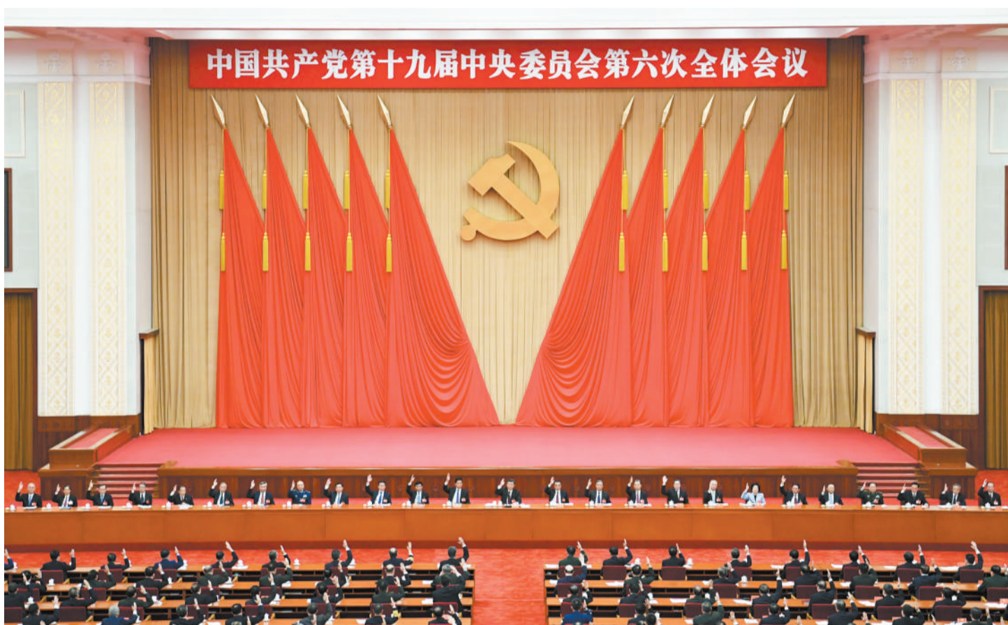
中国共产党第十九届中央委员会第六次全体会议,于2021年11月8日至11日在北京举行。