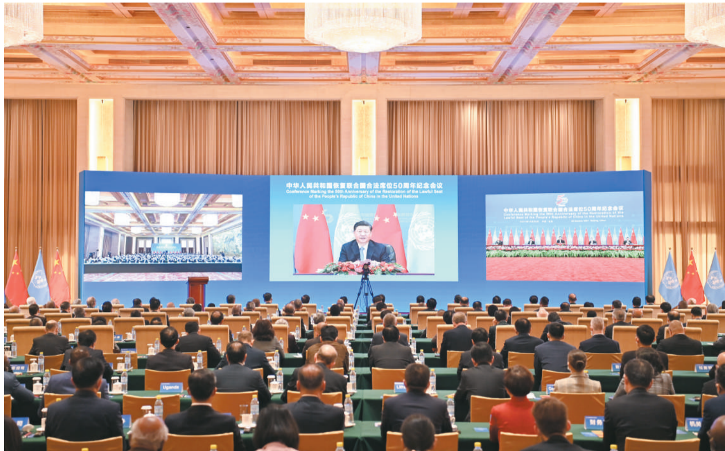
国家主席习近平在北京出席中华人民共和国恢复联合国合法席位50周年纪念会议并发表重要讲话。

新华社北京10月25日电 国家主席习近平25日在北京出席中华人民共和国恢复联合国合法席位50周年纪念会议并发表重要讲话。习近平强调，新中国恢复在联合国合法席位以来的50年，是中国和平发展、造福人类的50年。中国将坚持走和平发展之路，始终做世界和平的建设者；坚持走改革开放之路，始终做全球发展的贡献者；坚持走