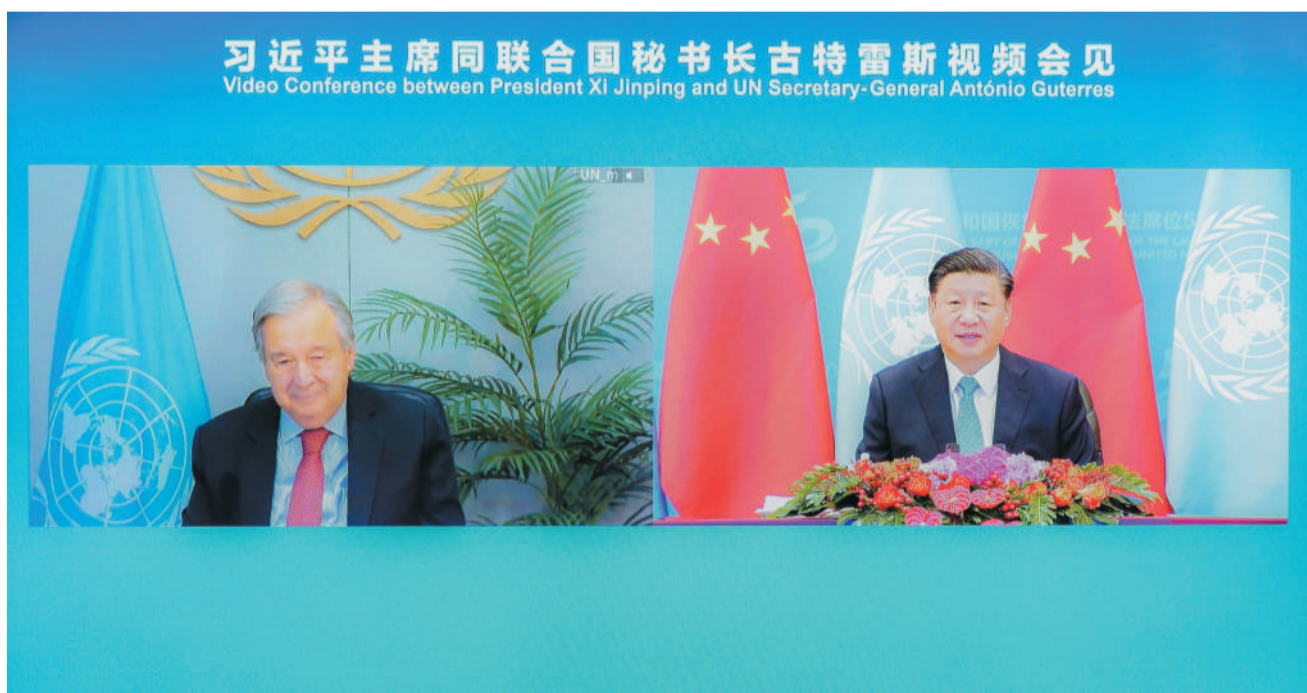
10月25日上午，国家主席习近平在北京人民大会堂以视频方式会见联合国秘书长古特雷斯。