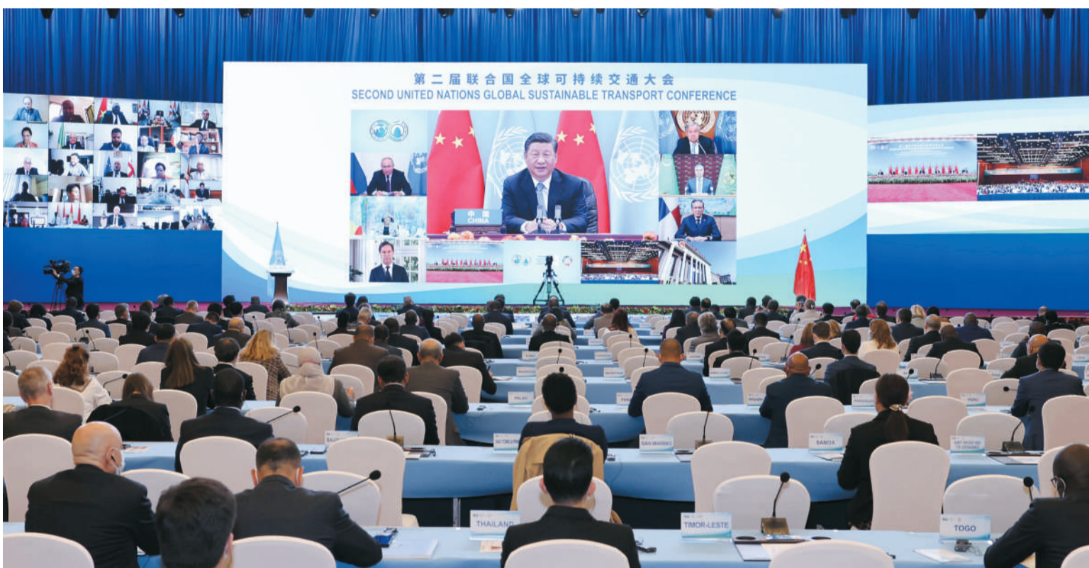
10月14日晚，国家主席习近平以视频方式出席第二届联合国全球可持续交通大会开幕式并发表题为《与世界相交 与时代相通 在可持续发展道路上阔步前行》的主旨讲话。

习近平指出，新中国成立以来，几代人逢山开路、遇水架桥，建成了交通大国，正在加快建设交通强国。我们坚持交通先行，建成了全球最大的高速铁路网、高速公路网、世界级港口群，航空航海通达全球。我们坚持创新驱动，高铁、大飞机等装备制造实现重大突破，新能源汽车占全球总量一半以上，港珠澳大桥、北京大兴国际机场等超大型交通工程建成投运，交通成为中国现代化的开路先锋。我们坚持交通天下，已经成为全球海运连接度最高、货物贸易额最大