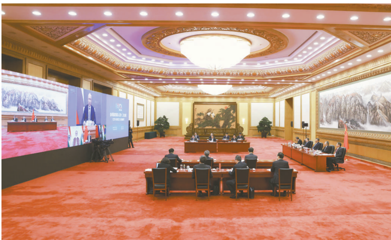
十一月十七日晚，金砖国家领导人第十二次会晤以视频方式举行。国家主席习近平在北京出席会晤并发表重要讲话。

新华社北京 11 月 17 日电 金砖国家领导人第十二次会晤 17 日晚以视频方式举行。俄罗斯总统普京主持，中国国家主席习近平、印度总理莫迪、南非总统拉马福萨、巴西总统博索纳罗出席。 习近平发表题为《守望相助共克疫情 携手同心推进合作》的重要讲话。习近平指出，当前，世纪疫情和百年变局交织，国际格局深刻演变。人类社会正在经历百年来最严重的传染病大流行，世界经济正在经历自 20 世纪 30 年代大萧条以来最严重衰退。在这样一个重要时刻，举行这次会晤，具有特殊重要意义。我们坚信，和平与发展的时代主题没有改变，世界多极化和经济全球化的时代潮流也不可能逆转。我们要为人民福祉着想，秉持人类命运共同体理念，用实际行动为建设美好世界作出应有贡献。 第一，要坚持多边主义，维护世界和平稳定。面对多边和单边、公道和霸道之争，金砖国家要坚定维护国际公平正义，高举多边主义旗帜，捍卫联合国宪章宗旨和原则，维护以联合国为核心的国际体系，维护以国际法为基础的国际秩序。尊重彼此根据自身国情选择的社会制度、经济模式、发展道路。倡导共同、综合、合作、可持续的安全观，