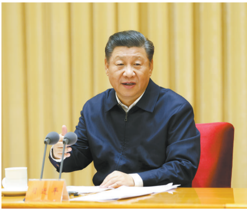
11 月 16 日至 17 日，中央全面依法治国工作会议在北京召开。中共中央总书记、国家主席、中央军委主席习近平出席会议并发表重要讲话。

会议强调，习近平法治思想内涵丰富、论述深刻、逻辑严密、系统完备，从历史和现实相贯通、国际和国内相关联、理论和实际相结合上深刻回答了新时代为什么实行全面依法治国、怎样实行全面依法治国等一系列重大问题。习近平法治思想是顺应实现中华民族伟大复兴时代要求应运而生的重大理论创新成果，是马克思主义法治理论中国化最新成果，是习近平新时代中国特色社会主义思想的重要组成部分，是全面依法治国的根本遵循和行动指南。全党全国要认真学习领会习近平法治思想，吃透基本精神，把握核心要义，明确工作要求，切实把习近平法治思想贯彻落实到全面依法治国全过程。 李克强主持会议。栗战书、汪洋、赵乐际、韩正出席会议。王沪宁作总结讲话。 习近平在讲话中强调，我们党历来重视法治建设。党的十八大以来，党中央明确提出全面依法治国，并将其纳入“四个全面”战略布局予以有力推进。党的十八届四中全会专门进行研究，作出关于全面推进依法治国若干重大问题的决定。党的十九大召开后，党中央组建中央全面依法治国委员会，从全局和战略高度对全面依法治国又作出一系列重大决策部署，推动我国社会主义法治建设发生历史性变革、取得历史性成就，全面依法治国实践取得重大进展。 习近平对当前和今后一个时期推进全面依法治国要重点抓好的工作提出了 11 个方面的要求。 习近平强调，要坚持党对全面依法治国的领导。党的领导是推进全面依法治国的根本保证。国际国内环境越是复杂，改革开放和社会主义现代化建设任务越是繁重，越要运用法治思维和法治手段巩固执政地位、改善执政方式、提高执政能力，保证党和国家长治久安。全面依法治国是要加强和改善党的领导，健全党领导全面依法治国的制度和工作机制，推进党的领导制度化、法治化，通过法治保障党的路线方针政策有效实施。 习近平强调，坚持以人民为中心。全面依法治国最广泛、最深厚的基础是人民，必须坚持为了人民、依靠人民。要把体现人民利益、反映人民愿望、维护人民权益、增进人民福祉落实到全面依法治国各领域全过程。推进全面依法治国，根本目的是依法保障人民权益。要积极回应人民群众新要求新期待，系统研究谋划和解决法治领域人民群众反映强烈的突出问题，不