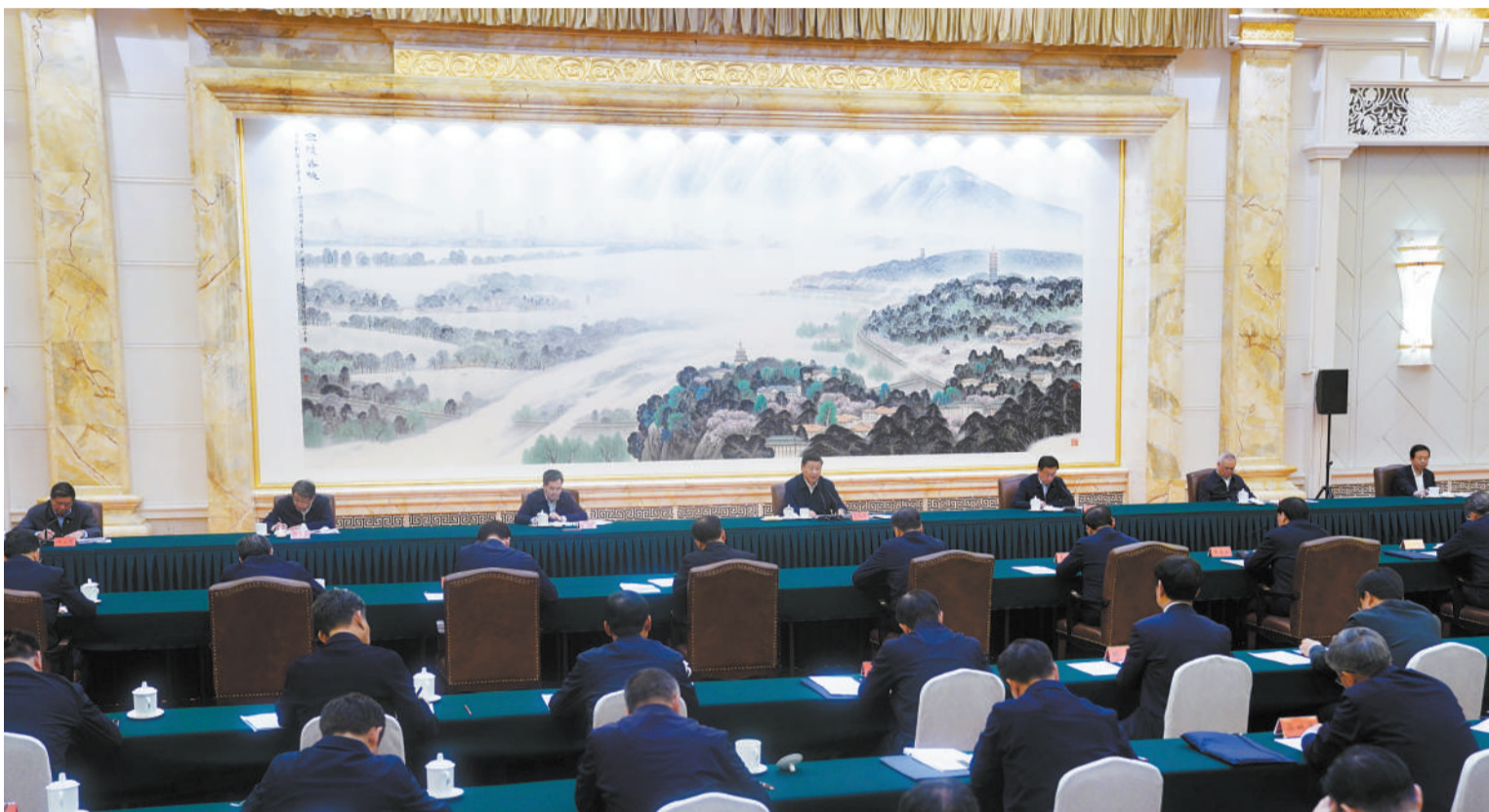
11 月 14 日，中共中央总书记、国家主席、中央军委主席习近平在江苏省南京市主持召开全面推动长江经济带发展座谈会并发表重要讲话。

新华社南京 11 月 15 日电 中共中央总书记、国家主席、中央军委主席习近平 14 日上午在江苏省南京市主持召开全面推动长江经济带发展座谈会并发表重要讲话。他强调，要贯彻落实党的十九届五中全会和十九届二中、三中、四中全会精神，坚定不移贯彻新发展理念，推动长江经济带高质量发展，谱写生态优先绿色发展新篇章，打造区域协调发展新样板，构筑高水平对外开放新高地，塑造创新驱动发展新优势，绘就山水人城和谐相融新画卷，使长江经济带成为我国生态优先绿色发展主战场、畅通国内国际双循环主动脉、引领经济高质量发展主力军。