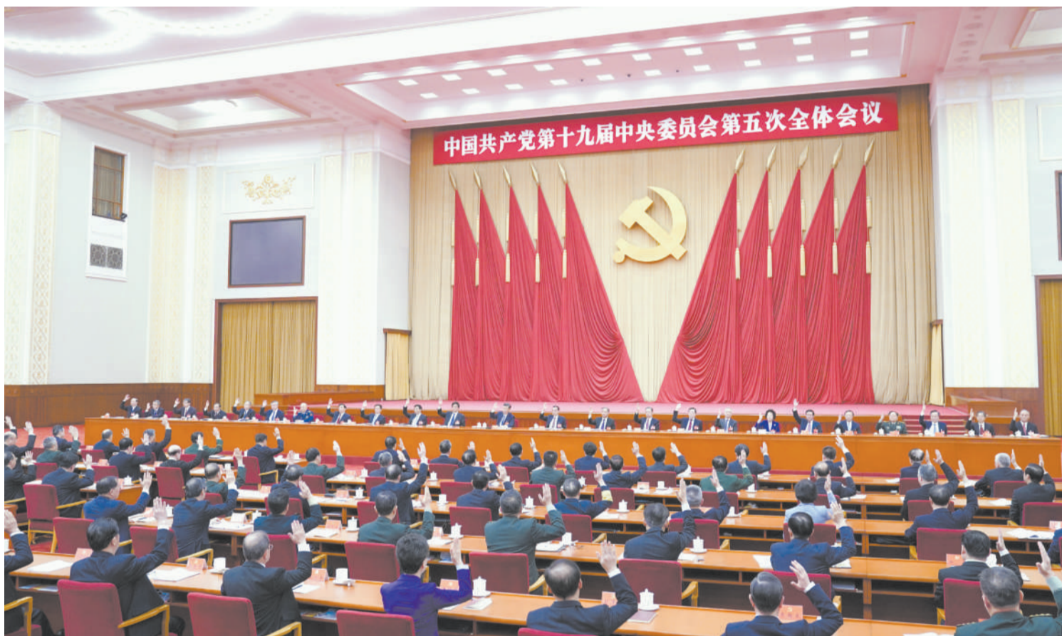
中国共产党第十九届中央委员会第五次全体会议，于 2020 年 10 月 26 日至 29 日在北京举行。中央政治局主持会议。