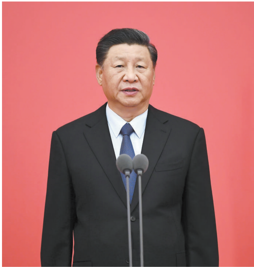
8 月 26 日,中国人民警察授旗仪式在人民大会堂举行。中共中央总书记、国家主席、中央军委主席习近平向中国人民警察队伍授旗并致训词。这是习近平致训词。