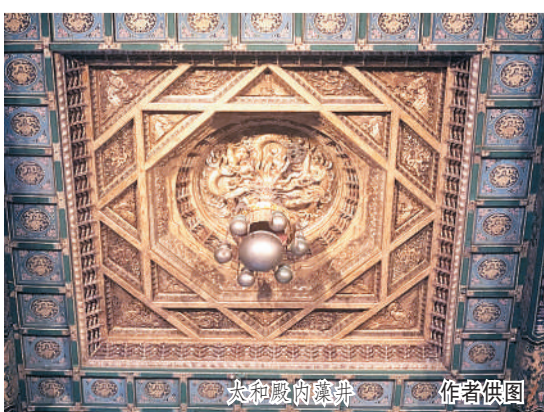
太和殿内藻井

太和殿藻井的平面布置呈对称之美。从藻井的平面组成来看,其核心木骨架由四边形外骨架、圆形内骨架,以及四边形与八角形交错形成的中间骨架组成。其中,四边形、八角形、圆形本身均为对称图形,