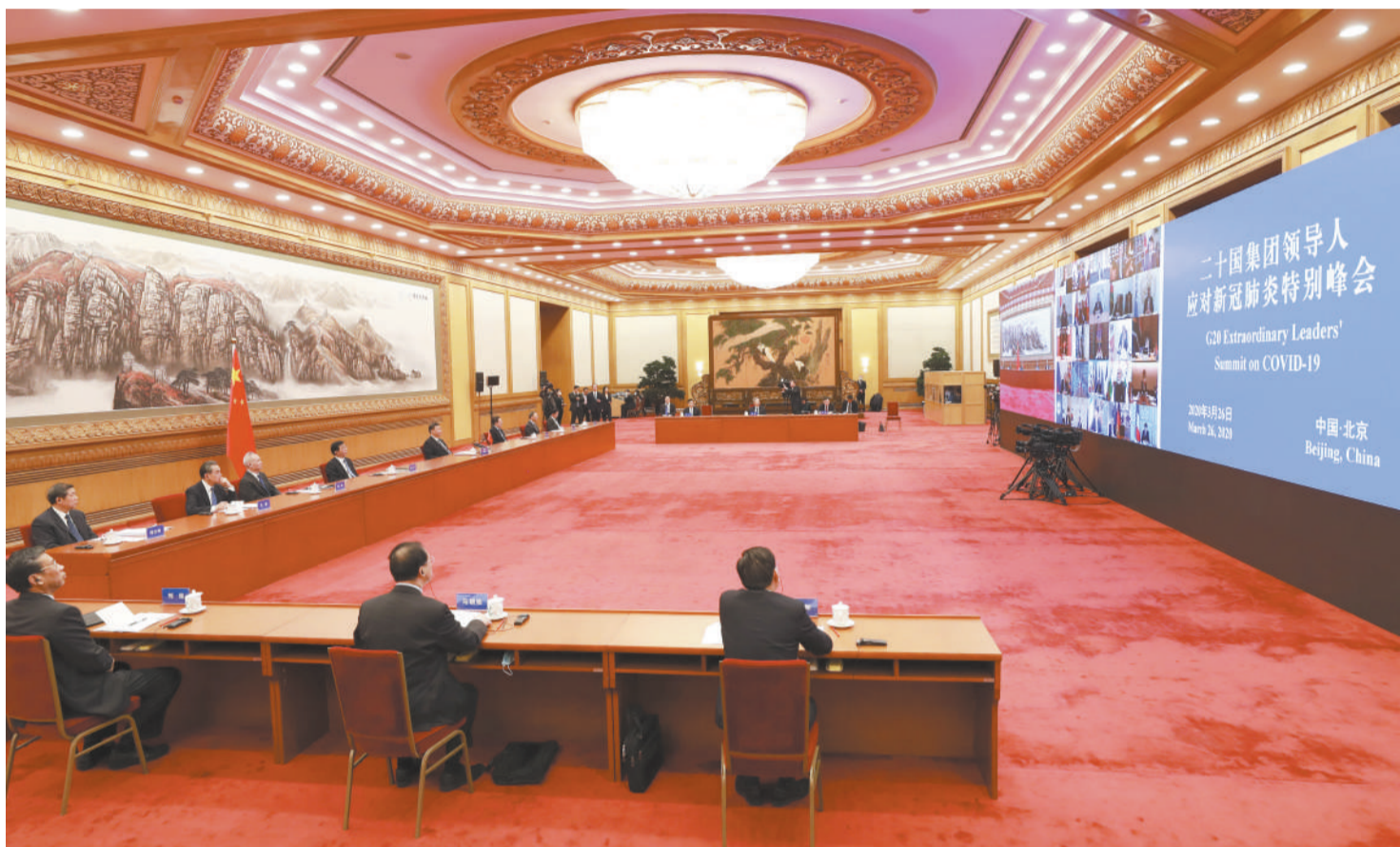
3 月 26 日,国家主席习近平在北京出席二十国集团领导人应对新冠肺炎特别峰会并发表题为《携手抗疫 共克时艰》的重要讲话。

新华社北京 3 月 26 日电 (记者杨依军)国家主席习近平 26 日晚在北京出席二十国集团领导人应对新冠肺炎特别峰会并发表题为《携手抗疫 共克时艰》的重要讲话。习近平强调,面对突如其来的新冠肺炎疫情,中国政府、中国人民不畏艰险,始终把人民生命安全和身体健康摆在第一位,按照坚定信心、同舟共济、科学防治、精准施策的总要求,坚持全民动员、联防联控、公开透明,打响了一场抗击疫情的人民战争。经过艰苦努力,付出巨大牺牲,目前中国国内疫情防控形势持续向好,生产生活秩序加快恢复,但我们仍然丝毫不能放松警惕。当前,疫情正在全球蔓延,国际社会最需要的是坚定信心、齐心协力、团结应对,携手赢得这场人类同重大传染性疾病的斗争。中方秉持人类命运共同体理念,