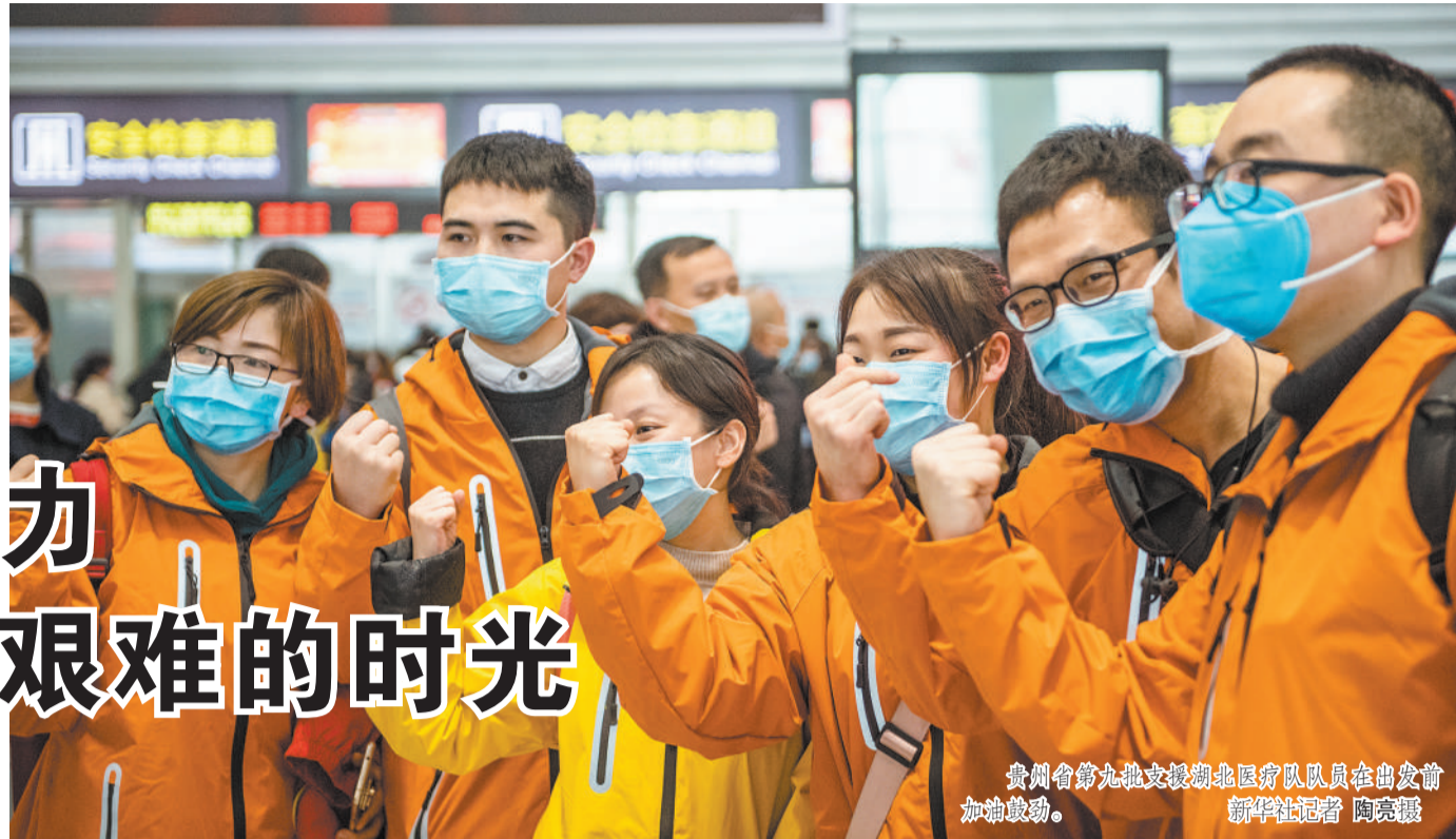
贵州省第九批支援湖北医疗队队员在出发前加油鼓劲。