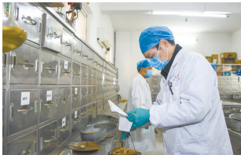
近期,湖北省孝感市中医医院加强中药汤剂的制作和供应,为全市多个区域提供针对新冠肺炎的中药汤剂,日均服务约 5000 人次。

孙春兰说,广大医务人员不惧风险、冲锋在前,为保护人民生命健康作出重要贡献,是抗疫战斗中的勇士。要全面落实进一步保护关心爱护医务人员的政策措施,及时安排医务人员轮换休整,不断加强科学防护和防止医院内感染,做好褒扬激励、抚恤优待、待遇保障等工作,使广大医务人员始终保持强大战斗力、昂扬斗志、旺盛精力,持续健康投入抗疫斗争。