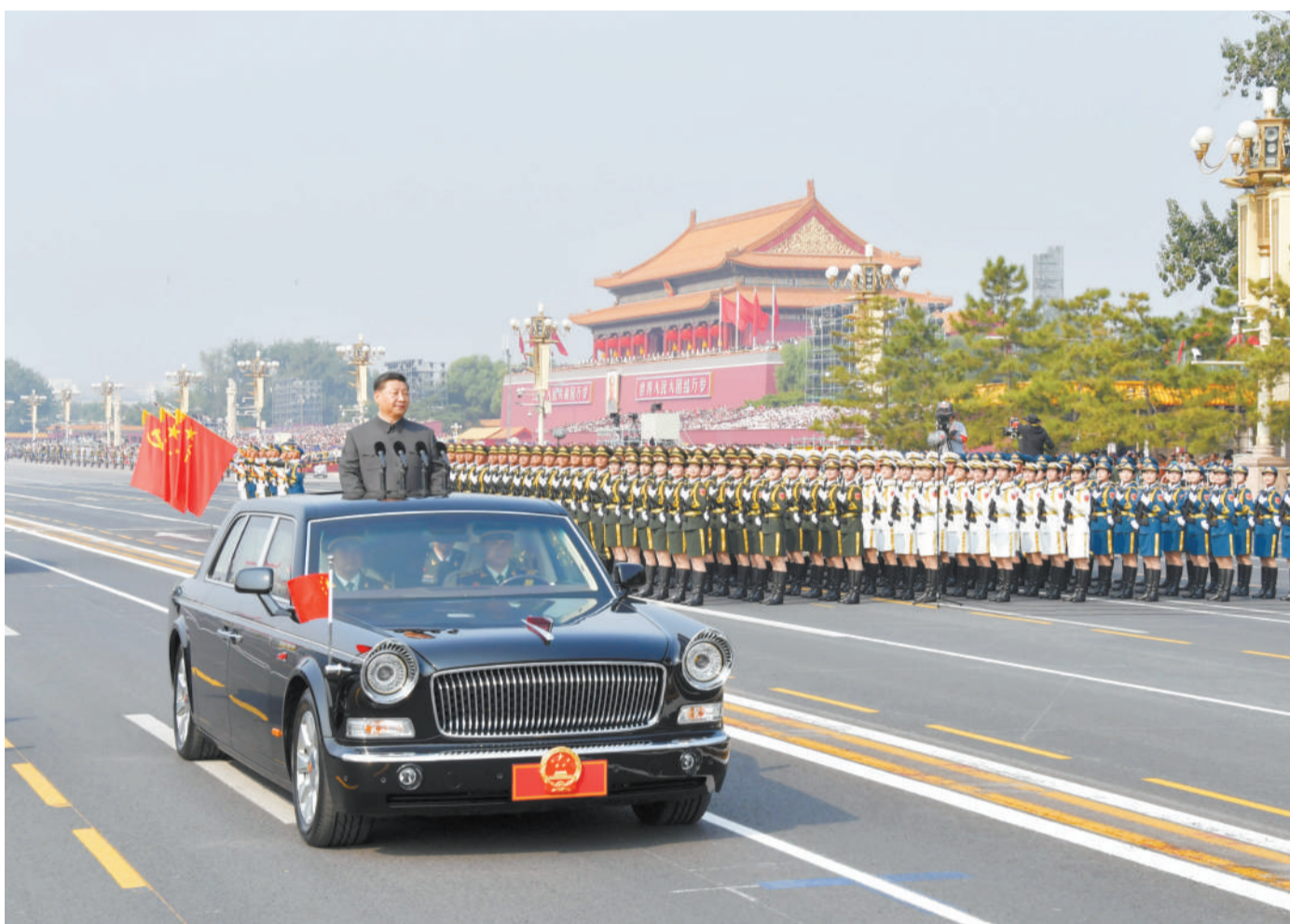
10月1日,庆祝中华人民共和国成立70周年大会在北京天安门广场隆重举行。这是中共中央总书记、国家主席、中央军委主席习近平检阅受阅部队。

■ 70年来,全国各族人民同心同德、艰苦奋斗,取得了令世界刮目相看的伟大成就。今天,社会主义中国巍然屹立在世界东方,没有任何力量能够撼动我们伟大祖国的地位,没有任何力量能够阻挡中国人民和中华民族的前进步伐