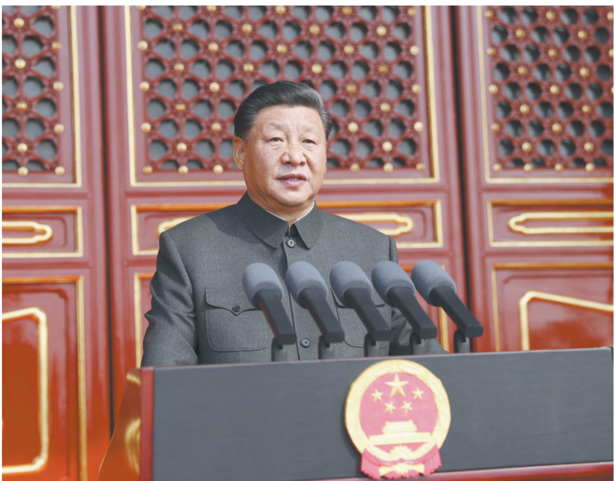
10月1日,庆祝中华人民共和国成立70周年大会在北京天安门广场隆重举行。中共中央总书记、国家主席、中央军委主席习近平发表重要讲话。