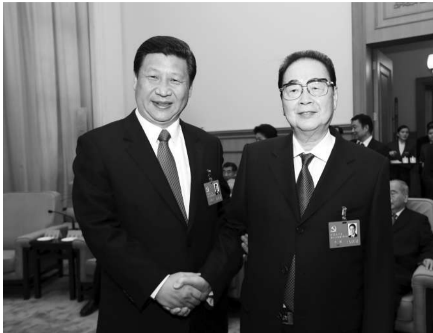
▲2012年11月14日,在党的十八大闭幕前,习近平同志同李鹏同志在一起。

李鹏同志是中国特色社会主义民主法治建设的重要领导者。1998年12月,他担任宪法修改小组组长,主持研究起草宪法