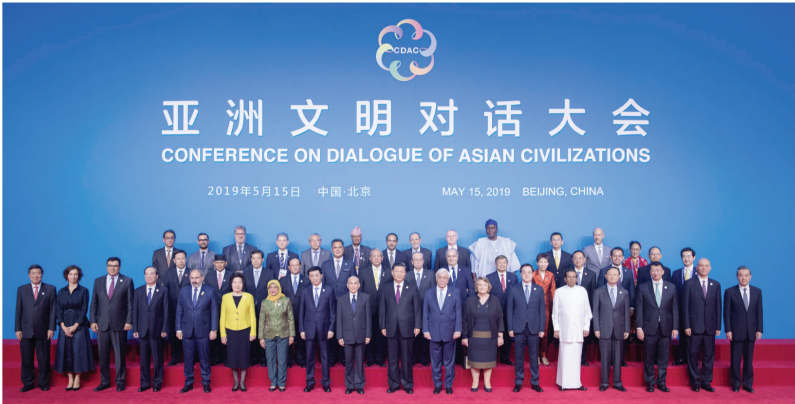
开幕式前, 中外领导人同出席开幕式的重要嘉宾代表合影留念。