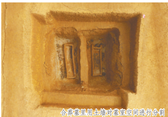
合葬墓里用土墙对墓室空间进行分割

由此可见,在距今5000年前后,中国史前社会动荡整合的广阔背景下,屈家岭文化在自身高度发展的基础上,在区域互动中扮演了重要角色。