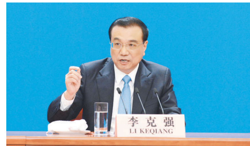
3月20日，十三届全国人大一次会议闭幕会后，国务院总理李克强在北京人民大会堂会见采访两会的中外记者并回答提问。

——中国人民是具有伟大梦想精神的人民。在几千年历史长河中，中国人民始终心怀梦想、不懈追求，我们不仅形成了小康生活的理念，而且秉持天下为公的情怀，盘古开天、女娲补天、伏羲画卦、神农尝草、夸父追日、精卫填海、愚公移山等我国古代神话深刻反映了中国人民勇于追求和实现梦想的执着精神。中国人民相信，山再高，往上攀，总能登顶；路再长，走下去，定能到达。近代以来，实现中华民族伟大复兴成为中华民族最伟大的梦想，中国人民百折不挠、坚忍不拔，以同敌人血战到底的气概，在自力更生的基础上光复旧物的决心，自立于世界民族之林的能力，为实现这个伟大梦想进行了170多年的持续奋斗。（下转第四版）