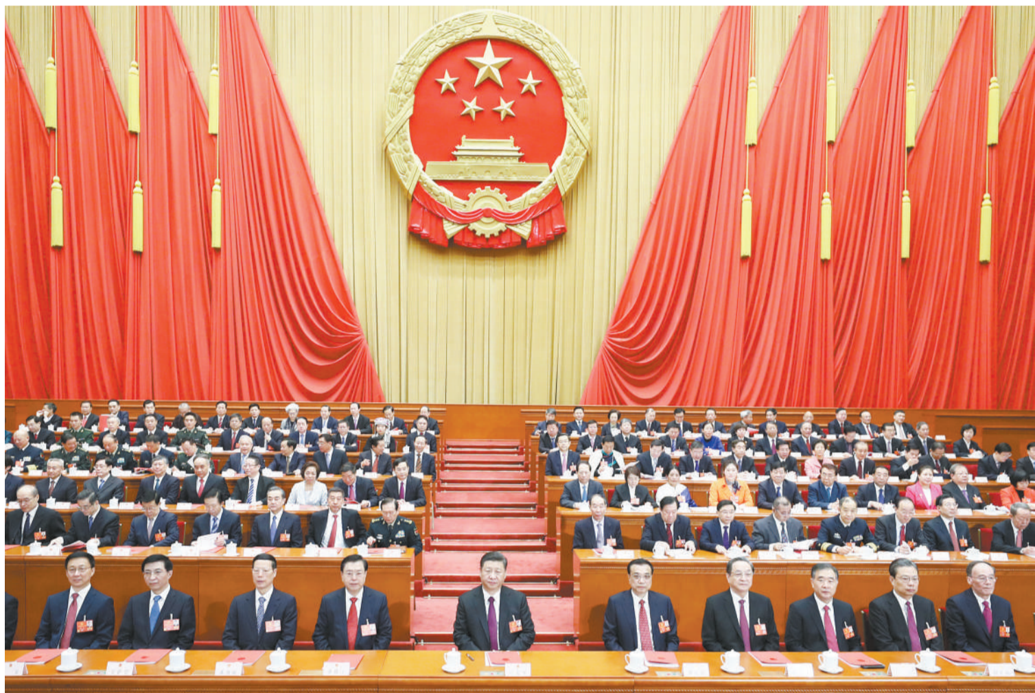
习近平等党和国家领导人在主席台就座。