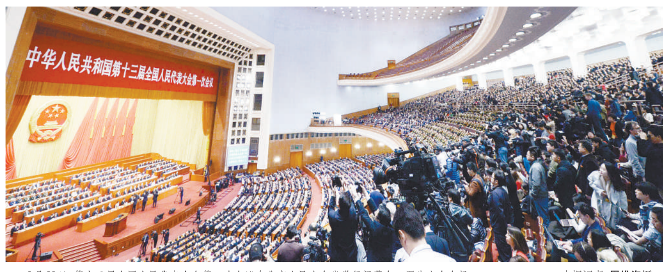
3月20日，第十三届全国人民代表大会第一次会议在北京人民大会堂举行闭幕会。图为大会会场。