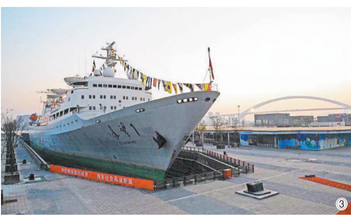
位于上海市黄浦区制造局路的江南机器制造总局,始建于1865年,见证了中国近代以来造船工业的发展历程,对中国早期工业产生了深刻影响。