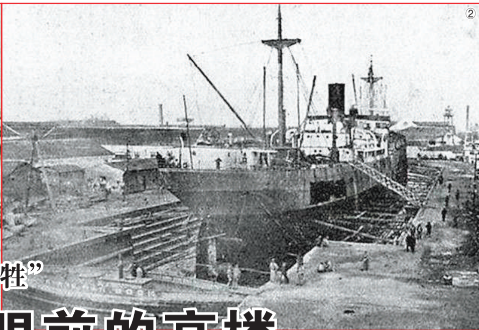
没有法律保护,工业遗产可能很快“牺牲”