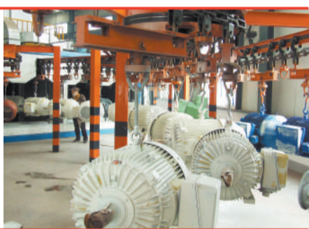
中国最大的防爆电机科研生产基地——南阳防爆集团生产车间

蔚蓝的天空下白云朵朵,一座座现代化厂房林立,宽阔平坦的道路四通八达,游园内市民正在观光休闲……短短几年,位于河南省南阳市宛城区的南阳新能源经济技术开发区,已是一座环境优美、低碳生态、产城一体的产业新城!这是宛城区大力推进科技创新促进生态工业的一个场景。