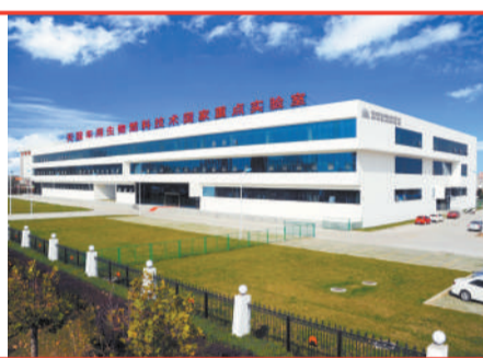
天冠集团车用生物燃料技术国家重点实验室