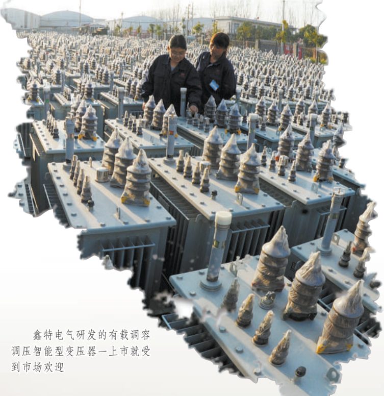
鑫特电气研发的有载调容调压智能型变压器一上市就受到市场欢迎

砥砺奋进的宛城,风起帆扬,千舟竞发;矢志发展的宛城,众志成城,万众创新。宛城区区长樊牛所说,下一步,宛城区将研究制订重大科技项目、科技成果转化和支持高新技术产业发展等扶持政策,以培育主导产业补齐发展短板,以加强创业平台建设提升创新能力,让科技兴区助推先进制造业强区再上新台阶。