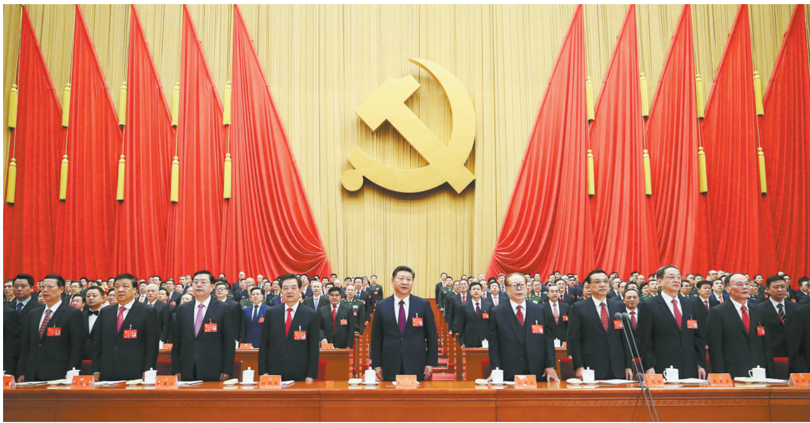
习近平、李克强、张德江、俞正声、刘云山、王岐山、张高丽、江泽民、胡锦涛在主席台上。