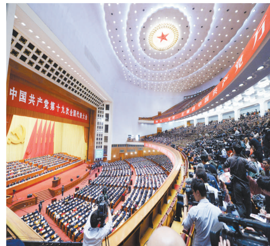
10月18日上午,党的十九大在人民大会堂开幕。