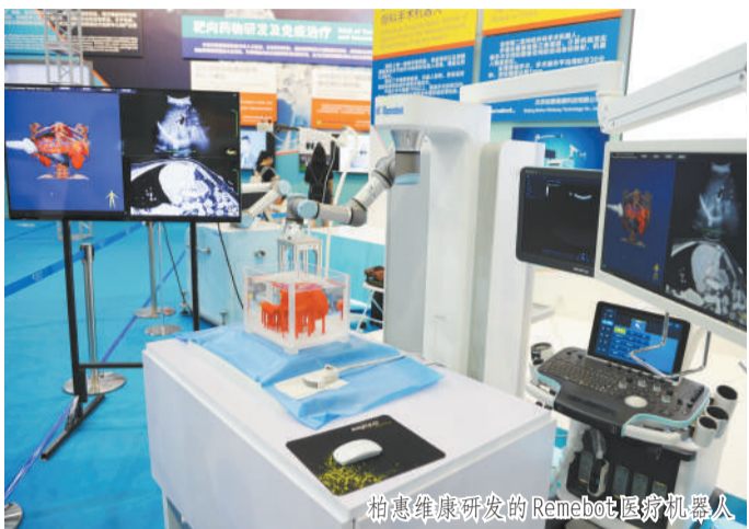
柏惠维康研发的RemeBot医疗机器人

下一步，北京市将以习近平总书记两次视察北京重要讲话精神为根本遵循，以全国科技创新中心建设为引领，着力做好“五个更加注重”，推动双创向纵深发展：一是更加注重推动硬科技创新。加强原始创新和核心技术突破，实施“十百千万”双创能力培育工程，系统推进“高精尖”产业发展，带动双创从商业模式创新为主的“软创业”向以智能硬件为代表的“硬创业”拓展。二是更加注重引导社会资本参与双创。拓展企业融资渠道，创新金融产品，深化投资联动试点，设立科技创新基金，鼓励高校、院所与社会资本共建技术转化机构和投资基金，引导风机构投资早期、投资硬科技、投资长期价值性企业。三是更加注重支持青年创新创业。支持大学科技园、孵化器中的学生创业项目，鼓励老师成为学生的天使投资人。扩大中关村雏鹰人才计划覆盖范围，对35岁以下人才首次创业给予一次性研发资金支持。四是更加注重优化营商环境。发布实施优化营商环境实施方案，深入推进京津冀和北京市全面改革创新试点，进一步推进外籍人才出入境便利化，加大对小微企业创新扶持力度，推动科技与金融深度融合，创新市场准入政策和监管模式，不断营造便捷、高效的创新创业环境。五是更加注重营造宜居宜业生态。进一步降低创业成本，在成果转化、企业孵化、产业培育、人才引进、住房保障等方面加强政策创新，加大“大城市病”治理力度，提升城市精细化管理水平，吸引更多优秀人才在京创新创业。