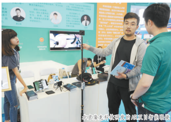
北京奥龙科技研发的AR双目智能眼镜