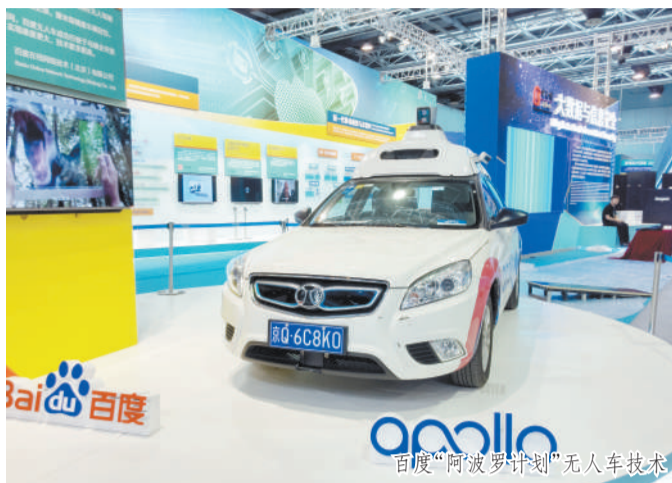
百度“阿波罗计划”无人车技术