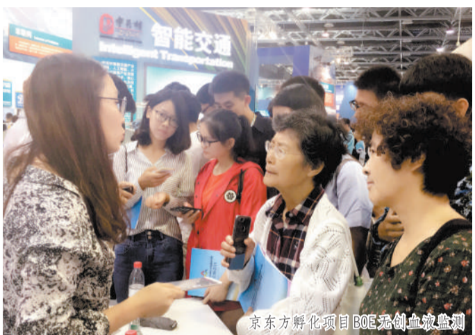
京东方孵化项目BOE无线血糖监测