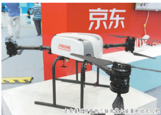
京东集团研发的三轴共架六旋翼电动无人机