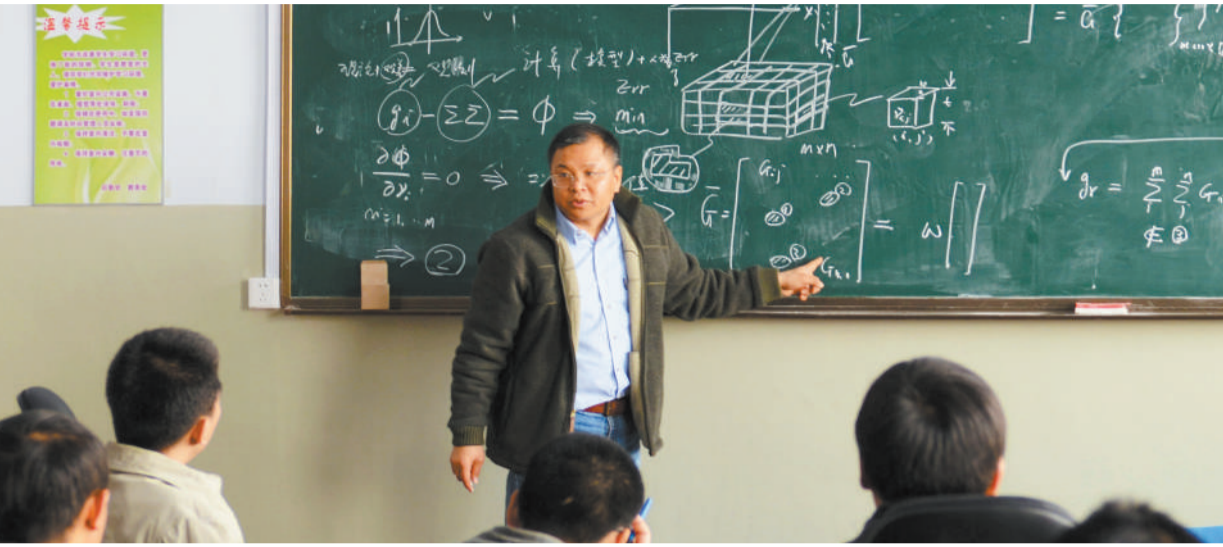
黄大年在为吉林大学的同学们授课(2011年4月10日摄)。

6天后，黄大年与吉林大学正式签下全职教授合同，担任吉林大学地球探测科学与技术学院教授。他因此成为东北地区第一个国家“千人计划”专家。