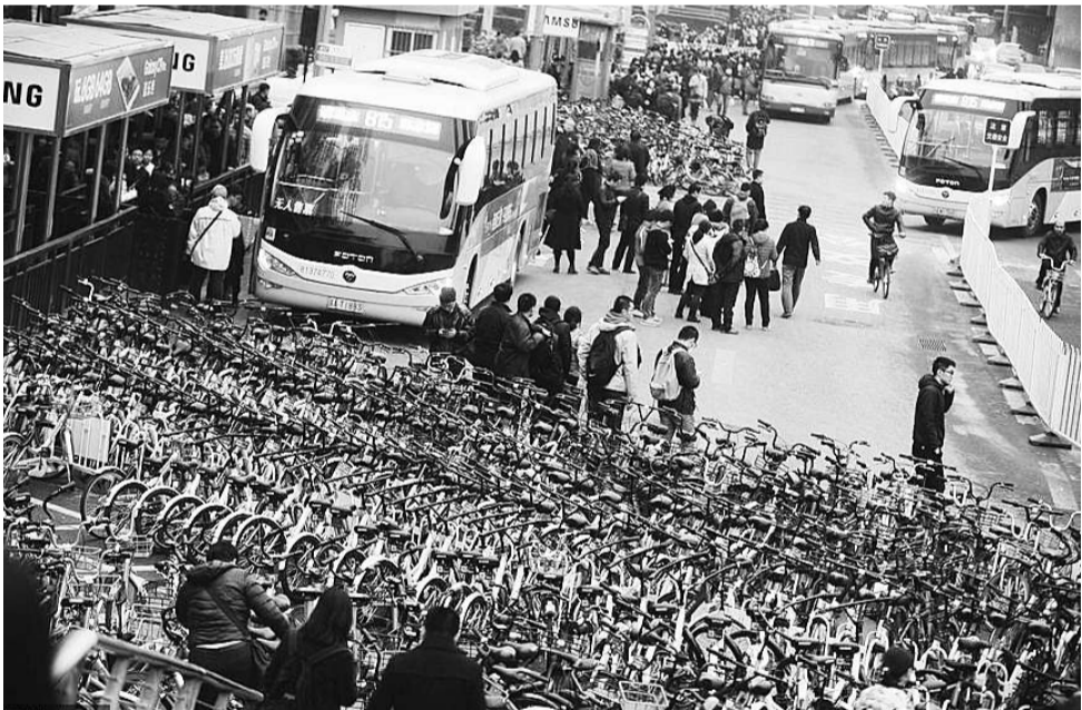
3月22日晚间,北京,位于大型桥东侧的公交车站被上千辆共享单车“围困”。八王坟东公交车站长期以来一直是CBD前往北京东部地区以及燕郊、大厂的客流集散地。22日晚高峰后,长达百米的公交站区域,被多个单车群占据。

在共享汽车领域,2月份,共享汽车品牌“PonyCar(马上用车)”宣布完成5000万天使轮融资。而3月份,友友用车宣布停止运营,成为国内共享汽车行业第一个倒下的案例。接着,分时租赁平台巴歌出行完成1000万元天使轮融资。