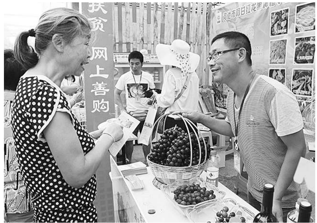
广西从2016年起启动实施“党旗领航·电商扶贫”行动,充分发挥“两新”党建的政治优势和组织优势,借助“互联网+”电商企业的平台技术和商业模式,整合各方面资源力量,在贫困农村扎实开展电商知识普及、电商技能培训、特色产品网销、创业就业网帮、慈善公益网助等活动,共推精准扶贫。图为河池市“党旗领航·电商扶贫”2016行动特色物产展销会现场。

两新组织的地位和作用,决定了两新党建工作在整个党建工作中越来越重要。党的十八大以来,中央持续深入推进全面从严治党,对两新党建这一党的建设新兴领域和薄弱环节高度重视。中央办公厅先后印发《关于加强和改进非公有制企业党的建