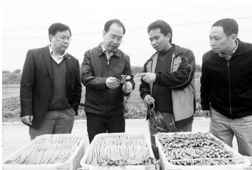
全国人大代表、广西梧州市市长朱学庆(左二)在藤县调研蔬菜基地助贫困户脱贫情况。

多项工作创造佳绩。易地扶贫搬迁工作进度排全区第1位。农村金融改革率先取得突破,信用村、信用村、信用镇创建工作走在全区前列。公安“神剑行动”成绩名列全区前茅,公安改革创新项目获全国公安机构改革大赛铜奖。苍梧县荣获“全国十大魅力茶乡”,并被认定为全国农村集体“三资管理”示范县。岑溪市创新开展双拥工作,被授予“自治区双拥模范城”称号。藤县安全生产工作成