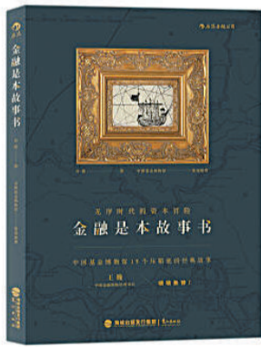
作者:许敬 出版社:鹭江出版社 出版时间:2016年4月