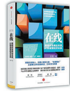
作者:王坚 出版社:中信出版集团 出版时间:2016年9月

这不仅仅是一本书,更是与阿里巴巴技术教父级人物长达十几个小时的面对面聊天。王坚手里拿的不是“三板斧”,而是“绣花针”。他说:“这个世界大家都在讲创新,热门的新词层出不穷,但我觉得最重要的三个关键词要讲清楚:互联网、数据和计算。”马云在序言中称“第一次见到王坚博士时,我震撼于他对互联网技术未来发展的理解,有一种相见恨晚的感觉。”“假如10年前我们就有了王坚,今天阿里的技术可能会很不一样。”自出版以来,《在线》受到不少技术帝的关注。大型阅读平台掌阅科技第一时间便拿到电子版版权。翻开这本书,你将与王坚一起走进他天马行空、奇思妙想的技术世界,那将是一个颠覆你认知,让你脑洞大开、恍若隔世的奇特经历。