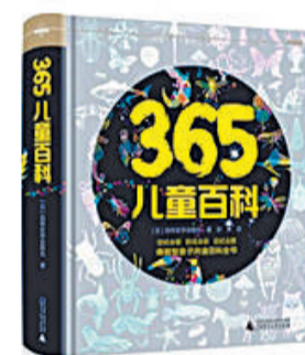
作者:[日]自然史学会联合著 译者:郭勇 出版社:广西师范大学出版社 出版时间:2016年10月

几乎所有的父母,都被孩子的问题问住过。你一般会怎么反应?自己不会答不要紧,推荐一本给8—15岁孩子读的《365儿童百科》。