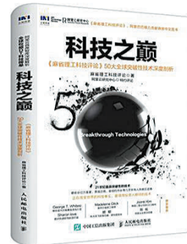
作者:麻省理工科技评论 出版社:人民邮电出版社 出版时间:2016年10月

正如《麻省理工科技评论》主编JasonPontin所说,突破性技术的定义非常简单,那就是能够给人们带来高质量运用科技的解决方案。有些技术是工程师们天才创意的结晶;而有的则是科学家们对长期困扰他们的问题所采取的诸多尝试的集大成者(比如深度学习)。评选“10大突破技术”的目的不仅是向人们展示新创新成果,同时也是为了强调是人类的聪明才智促成了这些创新技术。