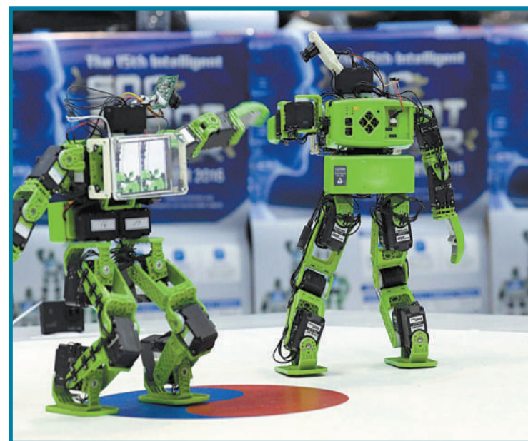
▲10月14日,韩国高阳,2016年国际机器人比赛举行,两个机器人展开跆拳道较量。