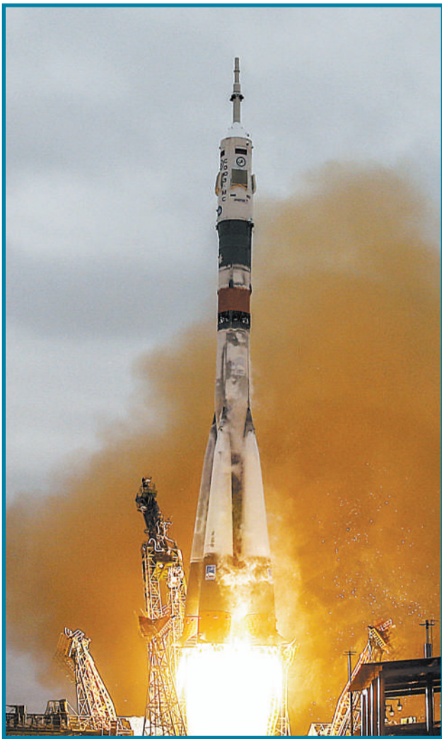
10月19日,哈萨克斯坦拜科努尔航天发射场,“联盟号”宇宙飞船发射。美国和俄罗斯宇航员搭载“联盟号”前往国际空间站。