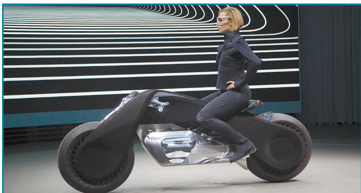
美国加州圣莫尼卡,宝马摩托部门展示其极具未来设计感的Vision Next100概念电动摩托车。