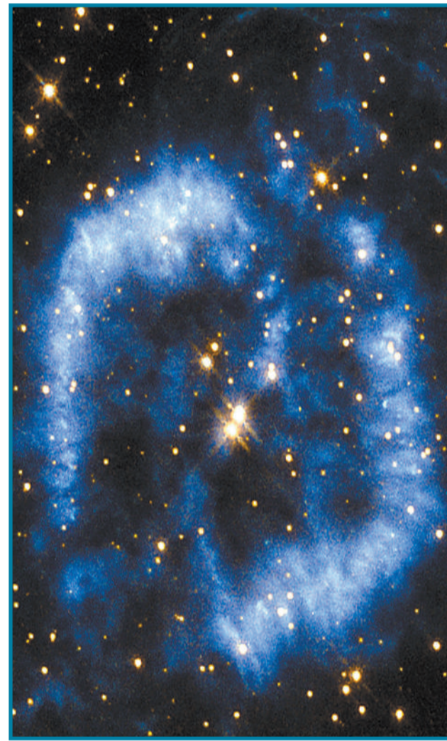
行星状星云PK329-02.2的美丽景象。该星云位于南天的矩尺座,距离地球大约8000光年。