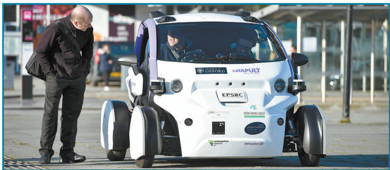
10月11日,英国米尔顿凯恩斯,无人驾驶豆荚车在街道上试运行。