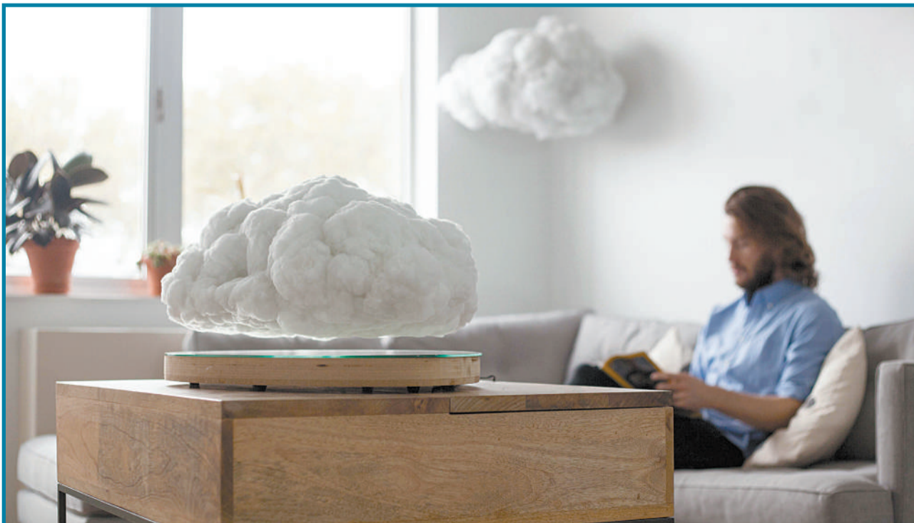
设计师设计的新型播放器。它由金属底座及距底座上方一英寸处漂浮的逼真云朵组成,内置蓝牙播放器和声音感应LED灯,能够在音乐播放时营造出虚拟的“雷暴”景象。