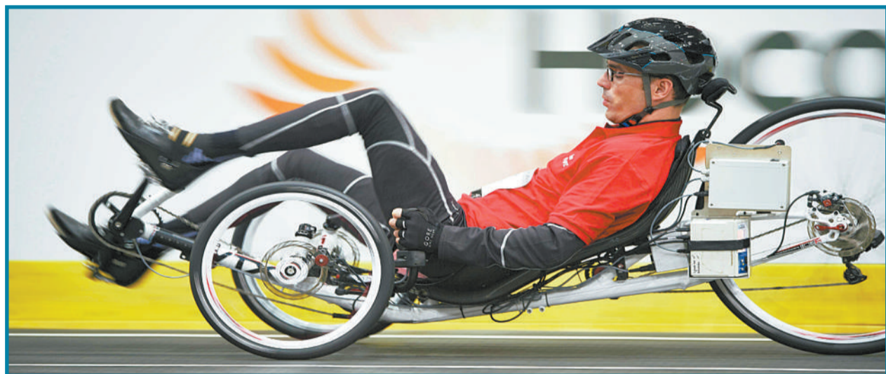
瑞士举办的全球第一届“人机体育大赛”。参加该赛事的运动员均为残疾人,需借助电子假肢或其他机器人装置进行比赛。