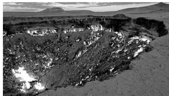
“地狱之门”是土库曼斯坦达瓦札的一处天然气田。1971年,这个天然气田的地面塌陷形成天然气坑,地质学家为了避免甲烷扩散而将气坑点火,使其一直燃烧至今。