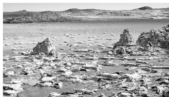
埃塞俄比亚的达纳基勒洼地是地球上最酷热的地方之一,也是Dallo1火山的所在地。天体生物学家正在对这些火山进行研究,试图了解其他行星上同样恶劣的环境中是否有可能诞生生命。