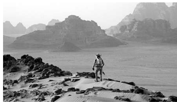
约旦的瓦地伦沙漠是2015年卖座电影《火星救援》的拍摄地。主演马特·达蒙走在这片酒红色的山谷砂地中,像极了火星上的场景。