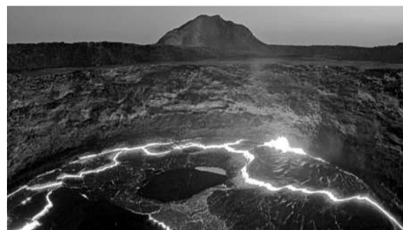
埃塞俄比亚的尔塔阿雷火山是一座盾形火山,这里是世界上最酷热的地方之一。该火山高度为613米,山顶有两个火山口,其中一个火山口拥有炙热的熔岩湖,吸引着世界各地的旅行者。