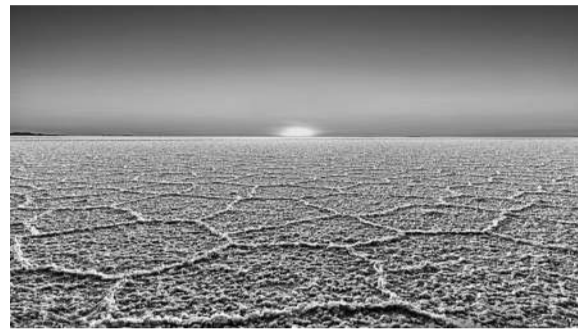
玻利维亚西南部的乌尤尼盐沼是世界上最大的盐沼,面积达10582平方公里。该盐沼是史前巨湖逐渐干涸后的残留,位于海拔约3700米的山区,一望无际的白色世界吸引着众多游客前来。

地球是一个充满美丽和奇迹的地方,有些地方的景观太过奇特酷似外星世界,很难让人相信这里竟然是地球。