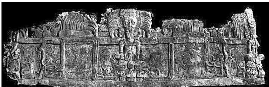
玛雅陵墓中雕刻精美的中楣,其中的主要角色是一个戴着鸟形太阳神头饰的国王,他坐在一个玛雅神神的头上。

此外,考古学家还发现这两座陵墓都有大量的手工制品,包括陶制品和用贝壳、兽骨、玉石做成的物件。