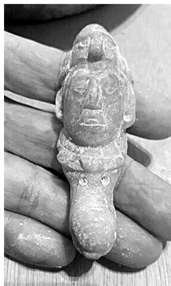
►考古学家发现一块玉制饰品上雕刻着一位戴着鸟形太阳神头饰的统治者形象,下方是一只鸬鹚的头部形象。