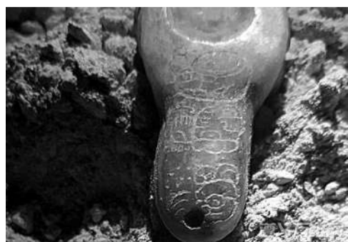
▲一件玉饰背面的文字写成英文是“Y-UUH YUKNOOM U-TI CHAN KAANUL AJAW”,意思是卡努尔的神圣国王名字是Yuknoom Uti Chaan。考古学家希望此次发掘能找到关于卡努尔王国统治者——绰号“蛇王”的更多线索。“蛇王”的绰号来自卡努尔统治者家族的蛇头形徽章。该家族统治着霍穆尔遗址以北约160公里外的一片区域。