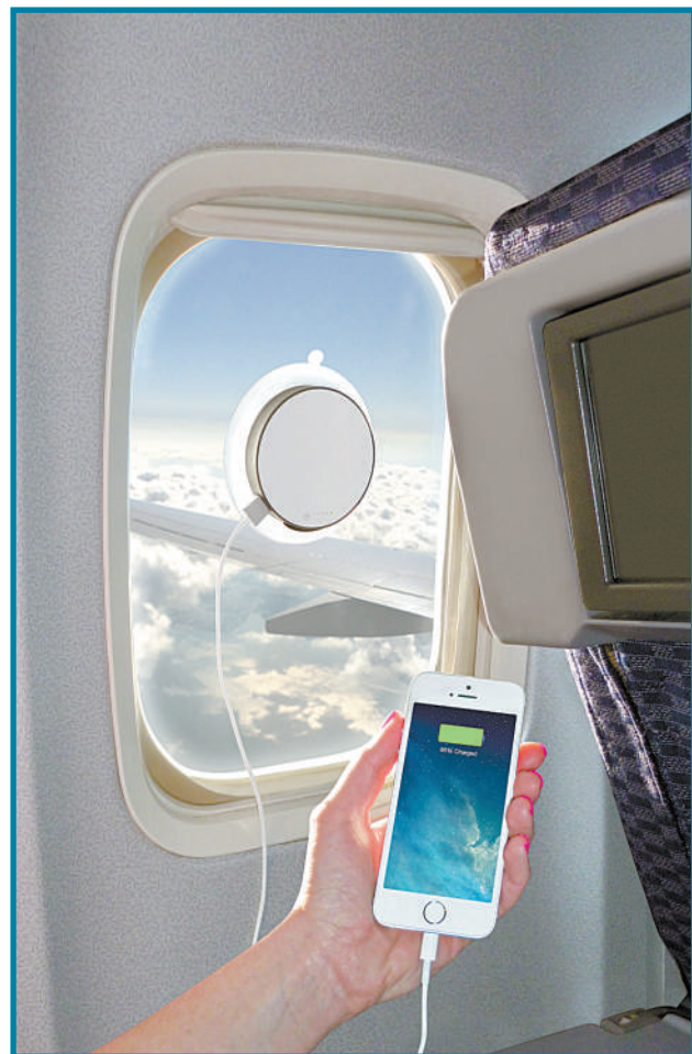
▲一款新的便携式电池面世,这款电池用太阳能板制作成吸盘形状,充分吸收阳光转化为能量。利用这款电池可以在外出途中如飞机上轻松给智能手机和平板电脑充电。