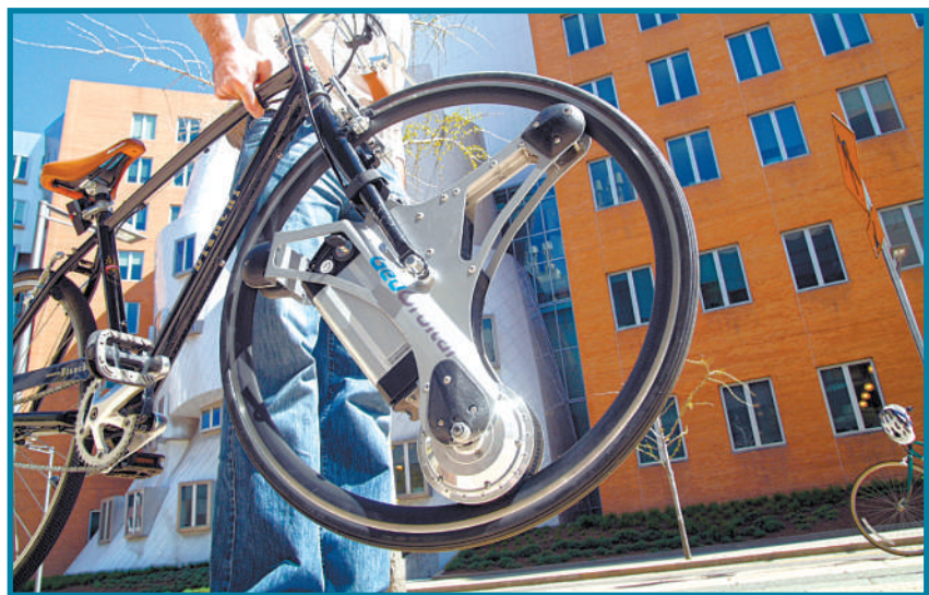
美国GeoOrbital公司发明的电动轮胎仅通过一把虎钳便可在一分钟内实现快速安装,骑行者不再需要费力地蹬踏板也不需要安装发动机,续航里程为80公里。