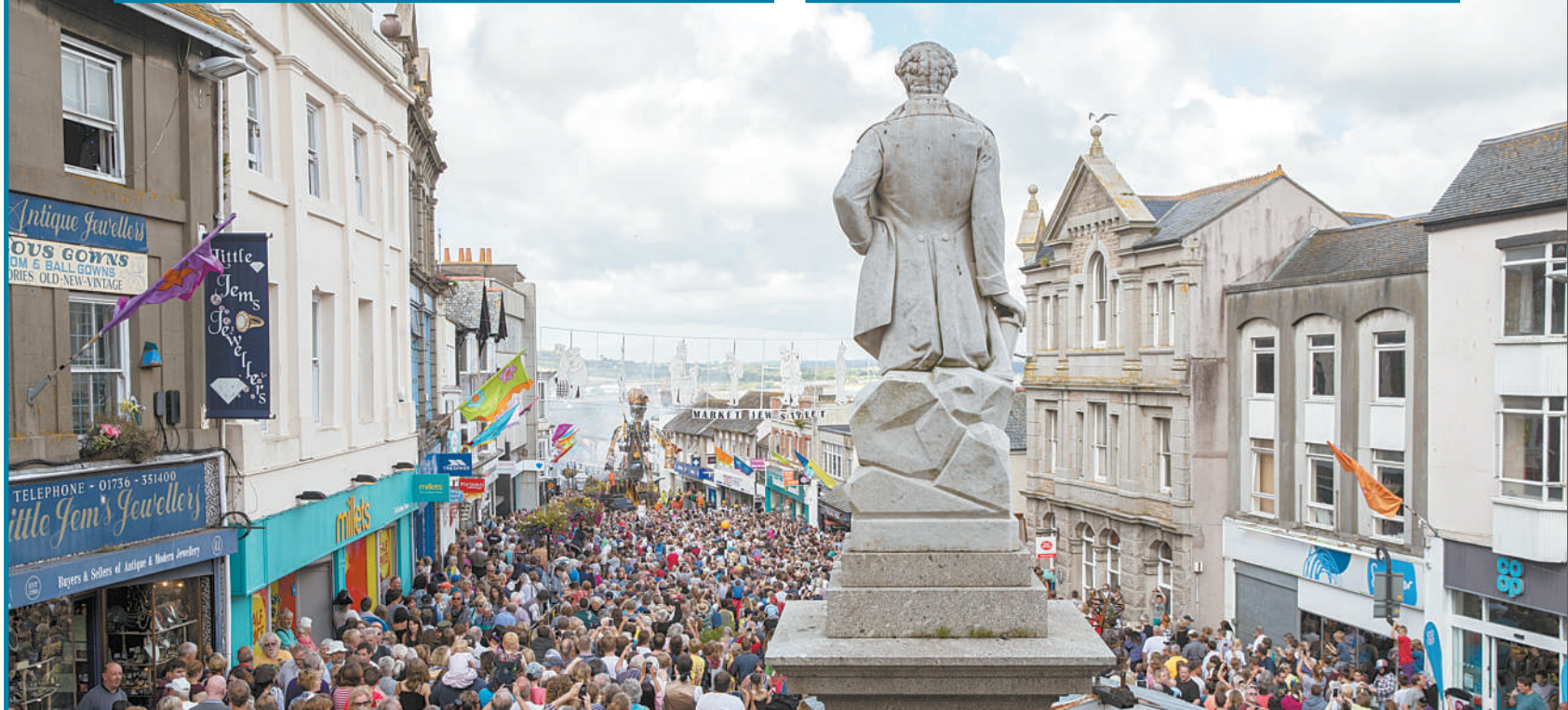
英国制造的最大机械木偶Man Engine近日在德文郡塔维斯托克首次亮相,即将开始长达2周、行程横跨209公里的穿越矿区遗址的壮举。据悉,这个机械木偶的身高超过3辆双层巴士叠起来的高度,体重达40吨。