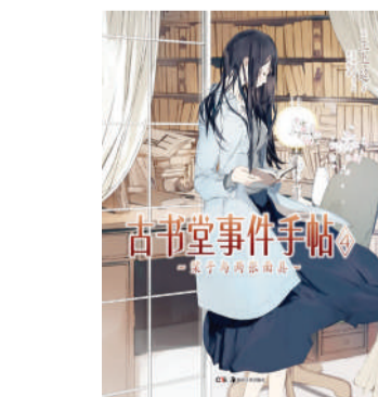
“流传于世的旧书背后,都深藏着一份情感,述说着人与人之间那无法消失的牵绊。”

因为我对这一系列书籍有着愉快的阅读经验,所以,我还是推荐大家有机会可以把这六本书连贯读下来。一定会很有畅快淋漓的感觉。当然,如果,你只想选择一本,也无妨。因为在每一本的头,作者都会讲述上一部的故事梗概。所以,你不用担心,即使是从第一本读起,也不会有任何阅读上的障碍。