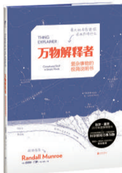
作者:兰道尔·门罗(美) 出版社:北京联合出版公司·未读 出版时间:2016年7月

我读的是我的专业以外的部分,房屋的结构,水管的布置,一棵树……我能看懂。我能看懂摩天大楼里有什么结构,我也明白作者对化学元素周期表的描述带有高级黑的色彩,我还能看出树根处的那些“挖洞者”每个都有所指代。我会笑,我会等着作者在