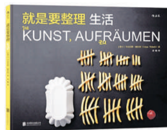
作者:乌尔苏斯·威利(瑞士) 出版社:北京联合出版公司·后浪 出版时间:2015年12月

这套画册真是高级视觉冷幽默。很多人觉得就是恶搞,可作者乌尔苏斯·威利听了非常不满,他说自己创造了“整理艺术”,还在瑞士专利协会申请了专利。