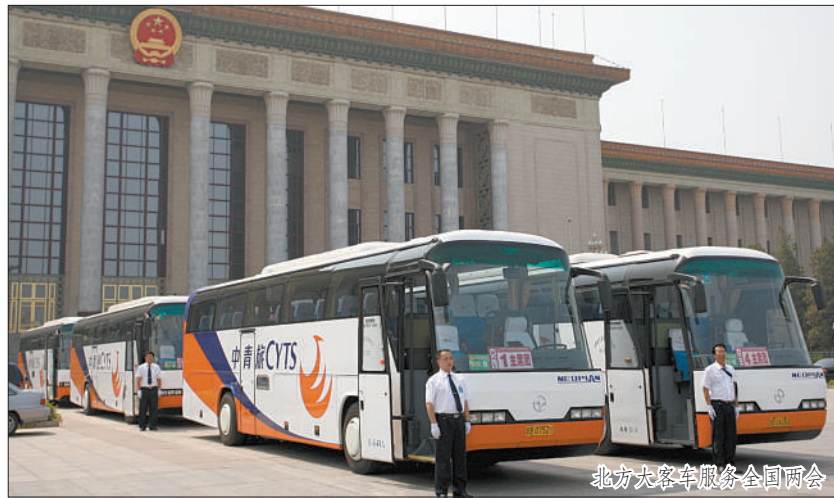
北方大客车服务全国两会