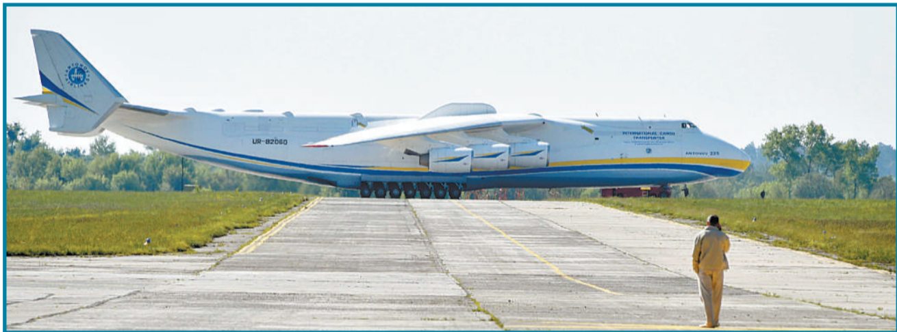
5月10日,乌克兰基辅,世界最大飞机安-225运输机装载130吨发电机前往澳大利亚珀斯。