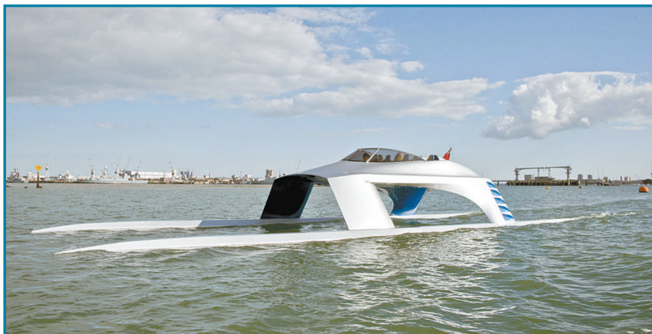
英国游艇公司推出的概念游艇。该艇拥有超高速度和未来感十足的外形,可在水上滑行,高出水面3米高的船舱中最多可乘坐5人。