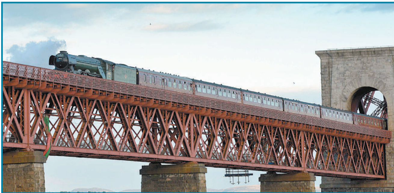
5月15日,英国蒸汽时代的象征,著名蒸汽机车“苏格兰飞人”跨越福斯铁路桥。