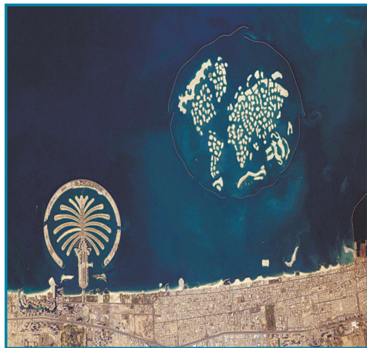
▲▲▼在国际空间站,地球观测是一项长期的任务。科学家从太空这样一个独特的位置观测地球,宇航员可以捕获一些平常摄影师所不能捕获的地球美景。国际空间站组员地球观测始于1961年,此后,图片一直不断更新,以随时记录地球变化。