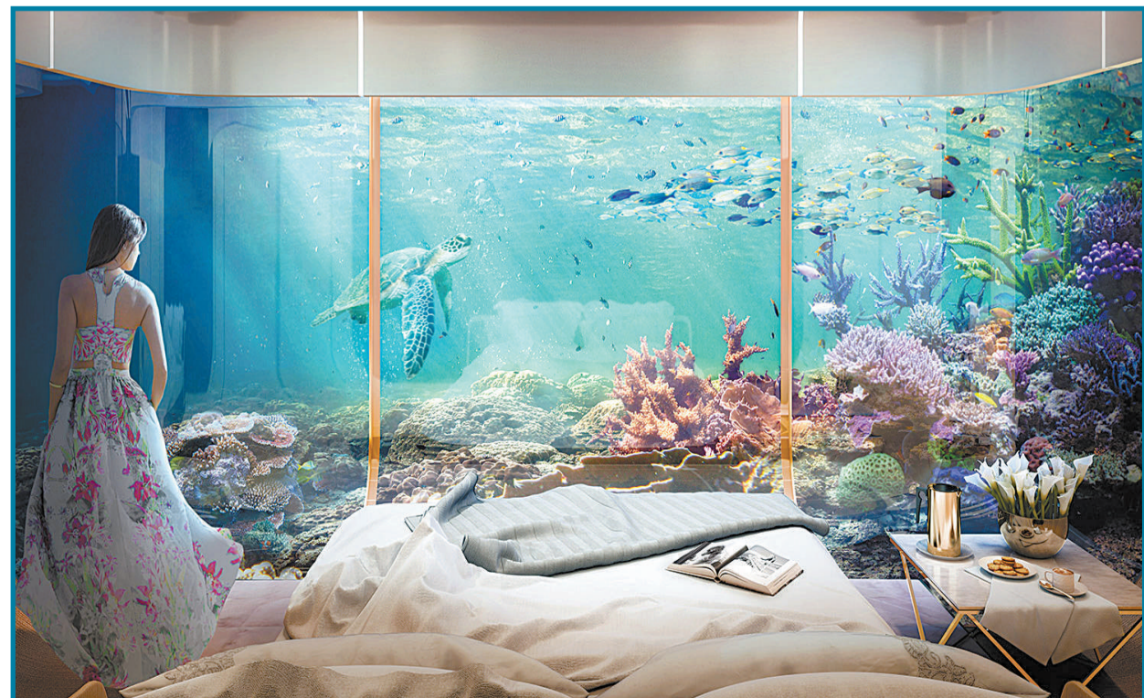
迪拜房产开发商获批在世界各地建造漂浮别墅。这些别墅将被建在海中,水上两层、水下一层,更有豪华水下浴室,可以在沐浴的同时欣赏五彩缤纷的海洋生物。