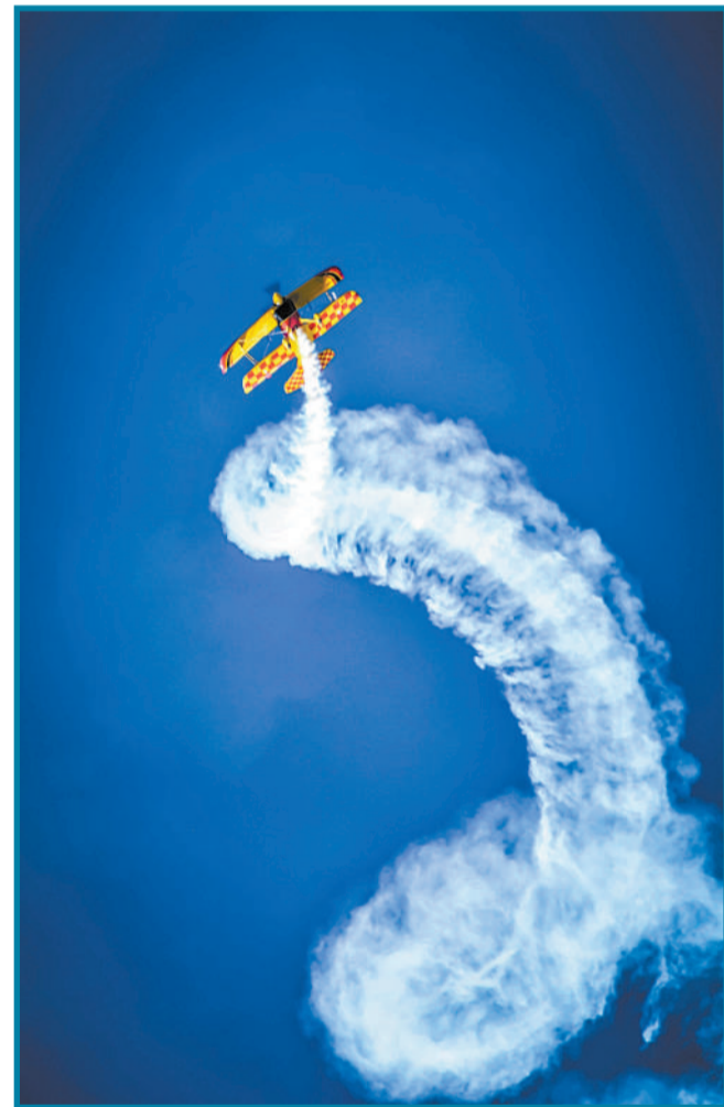
澳大利亚阿尔比恩公园,“Wings Over Illawarra”飞行特技表演活动上多国团队空中炫技。