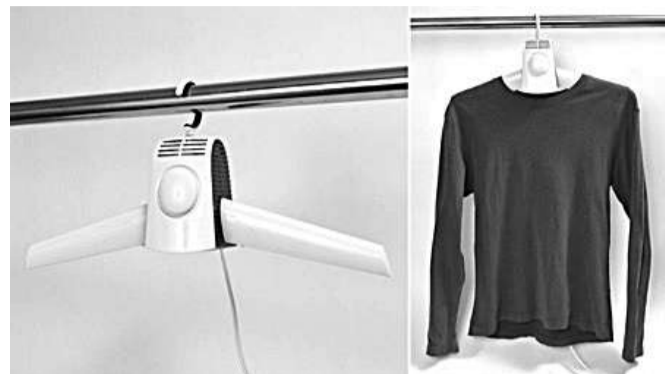
洗衣容易晾干,如果屋子里没有暖气,稍微厚重一点的衣服可能要花上两三天才能完全干透。这款电子烘干衣架可以吹出暖暖微风,用不了多久就能把上半截衣物完全烘干,另外还配有烘干鞋专用导管。