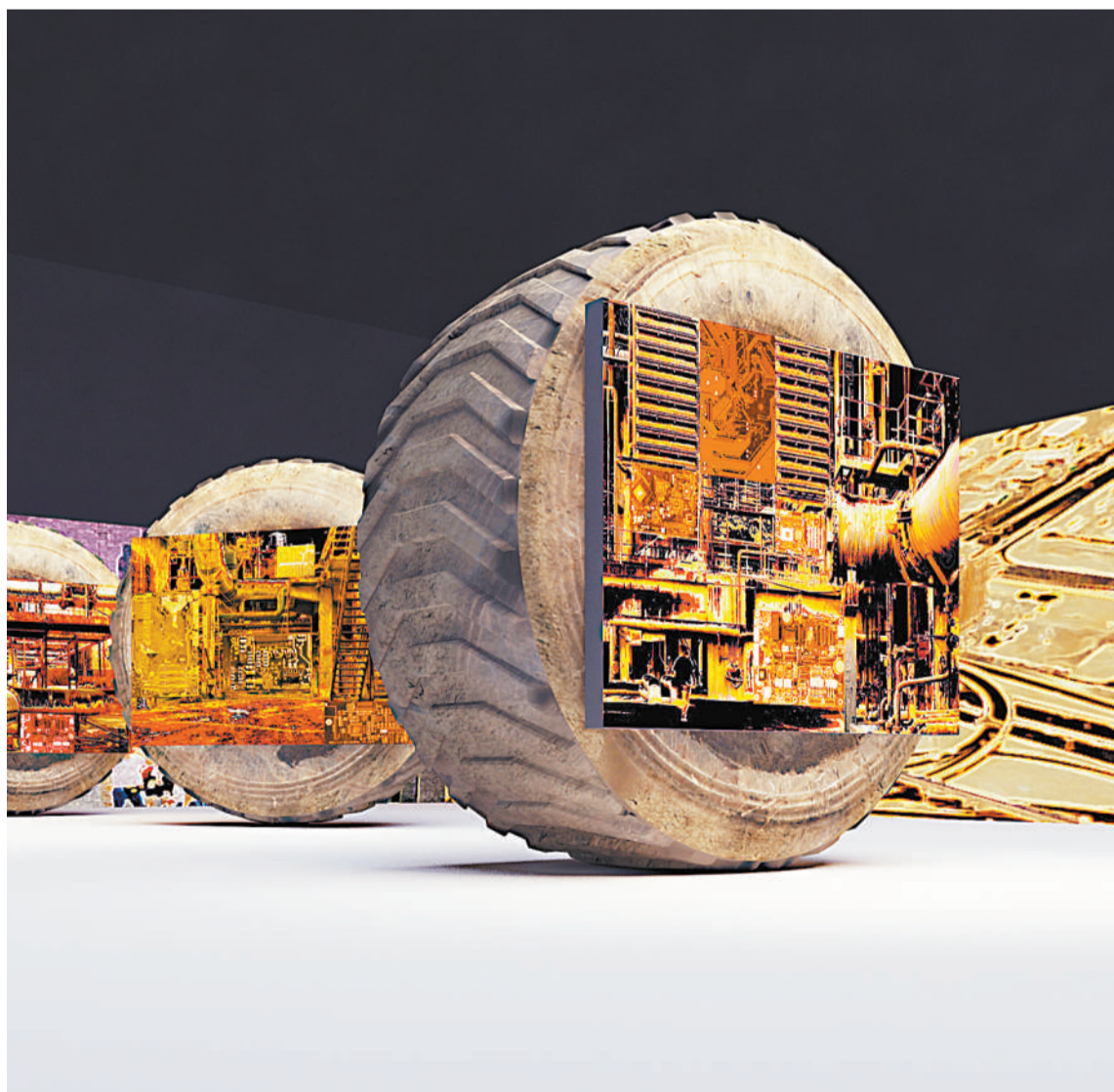
后工业时代(摄影装置)