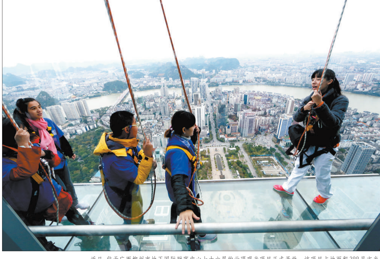
近日,位于广西柳州市地王国际财富中心七十六层的云顶观光项目正式开放。该项目占地面积388平方米,是集旅游、观光、游乐为一体的城市高空景观旅游景点。游客栈道体验为“5+2”模式,即每次5位乘客和2位安全教练一同完成体验,时长约30分钟。