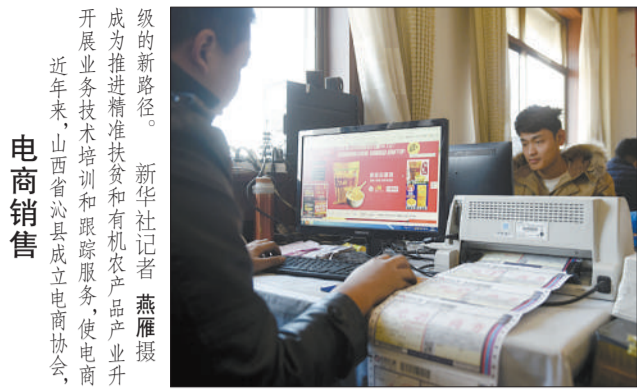
成为推进精准扶贫和有机农产品产业开展业务技术培训和服务,使电商近年来,山西省沁县成立电商协会,电商销售