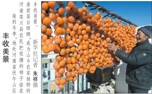
丰收美景。房前屋后晾晒,成为山乡农家独特的河南南川区农民把收获的柿子挂在每到冬季,地处河南省伏牛山区