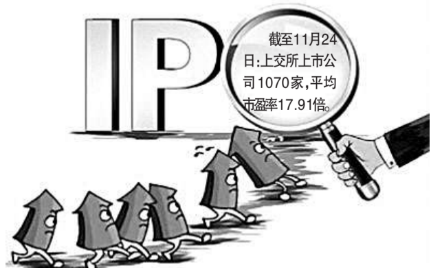
截至11月24日:上交所上市公司1070家,平均市盈率17.91倍

最近,中国证监会制定并发布《关于进一步推进全国中小企业股份转让系统发展的若干意见》(以下简称《意见》),加快推进全国股转系统发展。对于市场性质和在多层次资本市场体系中的定位,《意见》指出,要坚持全国股转系统独立市场地位,挂牌不是转板上市的过渡安排。但全国股转系统并非孤立市场,应着眼于建立多层次资本市场的有机联系,研究推出全国股转系统挂牌公司向创业板转板试点,允许符合条件的区域性股权市场运营管理机构开展推荐业务试点,探索建立与区域性股权市场的合作对接机制。