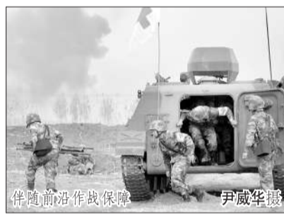
伴随前哨作战保障

正在冲锋的军士长老朱突然“中弹”受伤,跌倒在草沟里,老朱立即从新型单兵急救包掏出自救器材,同时迅速按下“伤员”呼救器。代表“危重”的红灯突闪,屏幕弹出伤员基本信息:现地坐标、血压脉搏、年