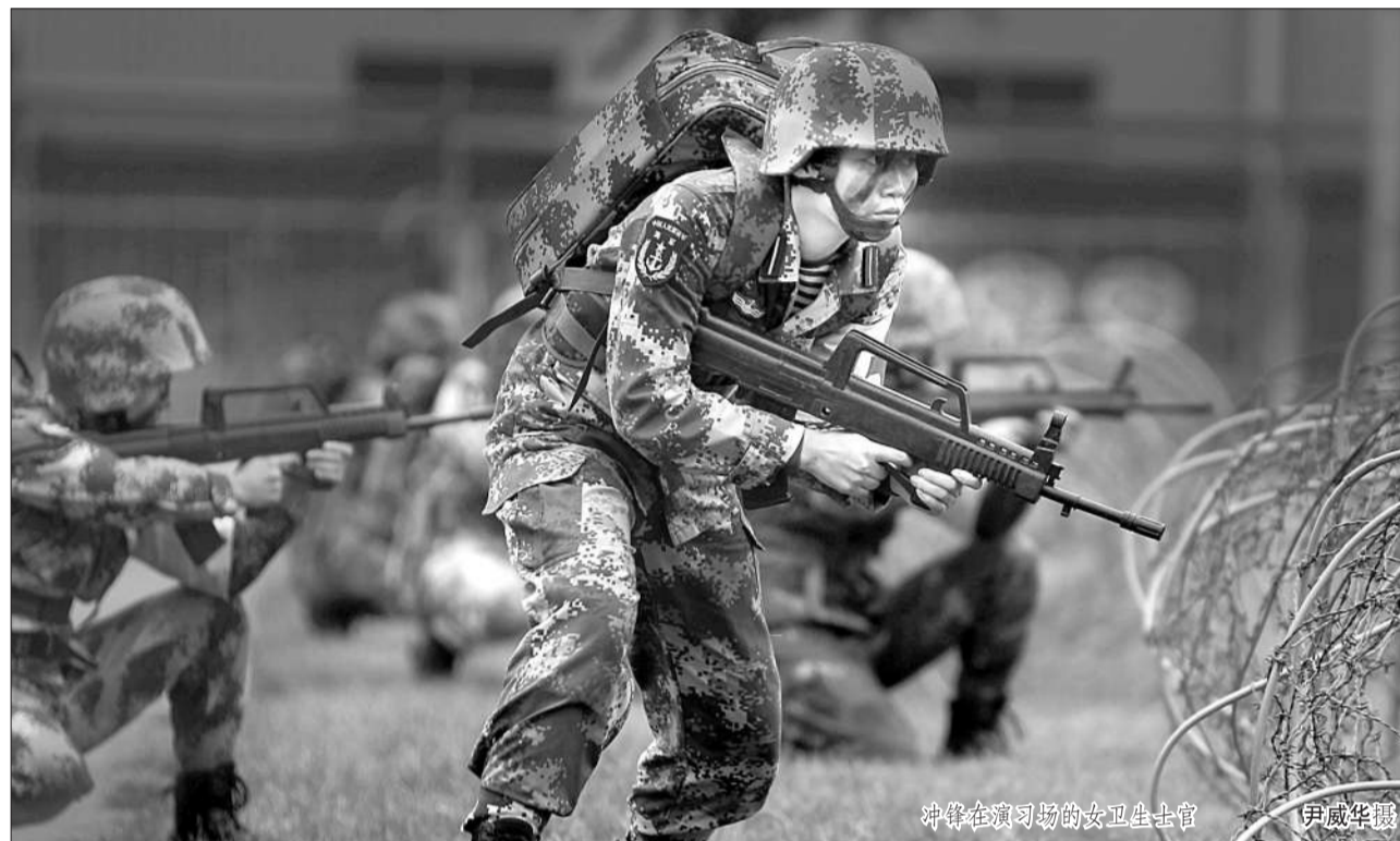
冲锋在演习场的女卫生士官

着眼现实,破解卫生士官能力模块。卫生士官伴随卫勤保障,不同兵种、不同地域迥异,特殊环境、特种作战要求又各不相同……该校对卫生士官能力模块进行庖丁