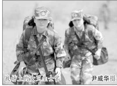
战场上的女卫生士官

龄血型……跟随作战的卫生员小李,快速流畅运用如手机的设备查阅信息,实时感知定位搜寻,隐蔽接近伤员,采取“镇痛、止血、包扎”等进一步“救急救命”措施。