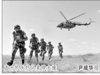
直升机医疗队索降支援