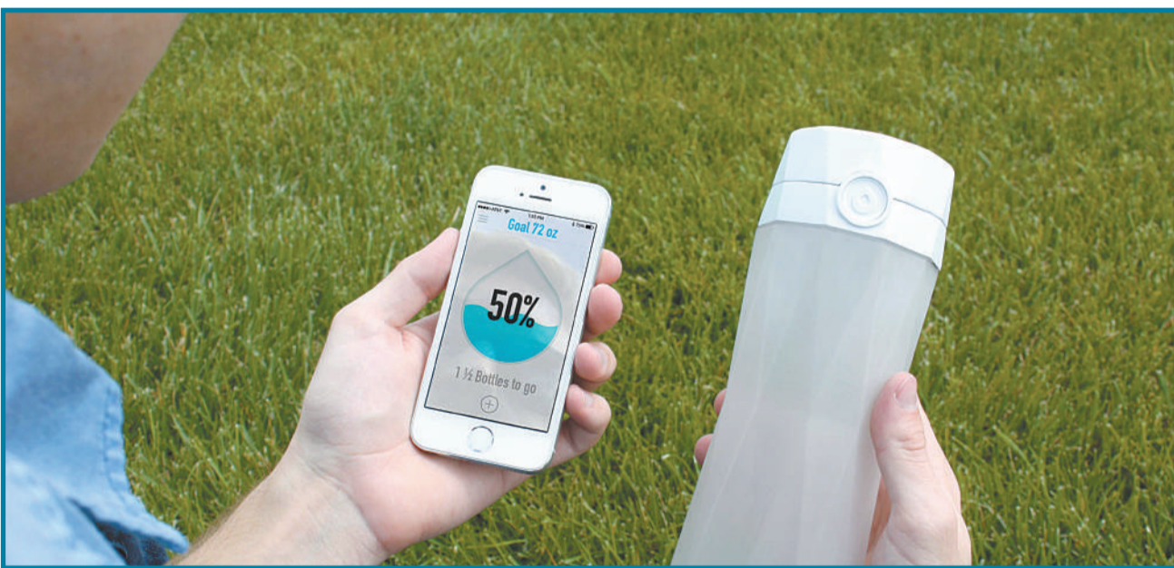
一款能够发光告诉你需要喝水的水杯。这款智能水杯能够与智能手机连接,通过一个感应器来追踪你喝了多少水,当你长时间没有摄取水的时候,水杯能够提供有效的警告。