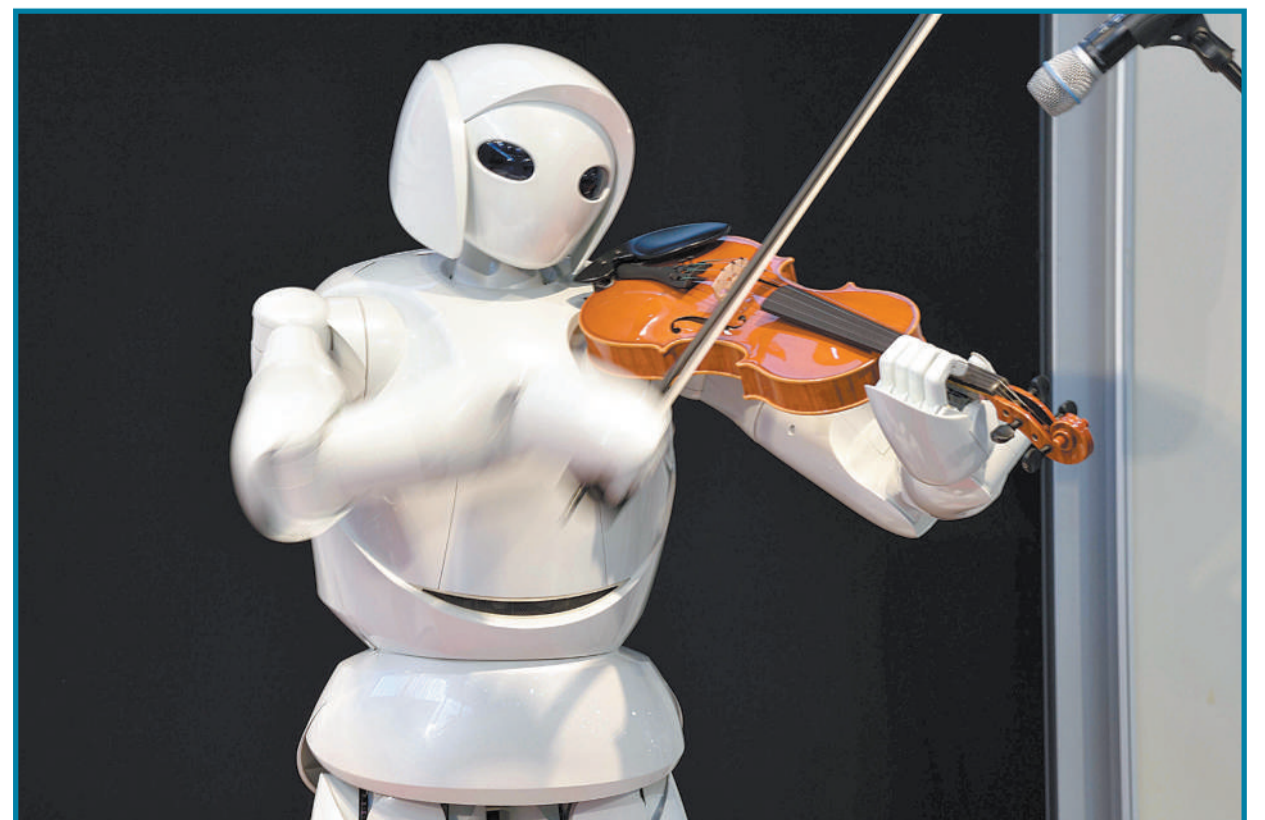
8月9日,日本举行“兴奋机器人公园”活动,该活动是为儿童举行的体验机器人活动。