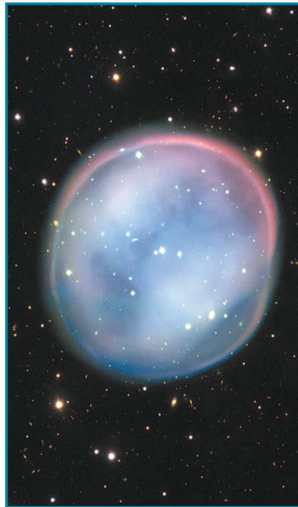
8月3日,欧洲南方天文台发布图片显示,垂死恒星的残留物形成的行星状星云。