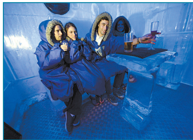
▲7月25日,西班牙马德里的冰酒吧成为人们避暑的好去处。酒吧内温度约为零下10摄氏度,与外面的炎炎夏日形成强烈对比。