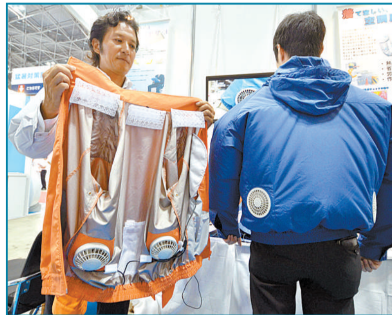
▼7月23日,日本东京,当地举办“消暑展”,日本公司生产的空调夹克、空调帽和空调背心亮相。