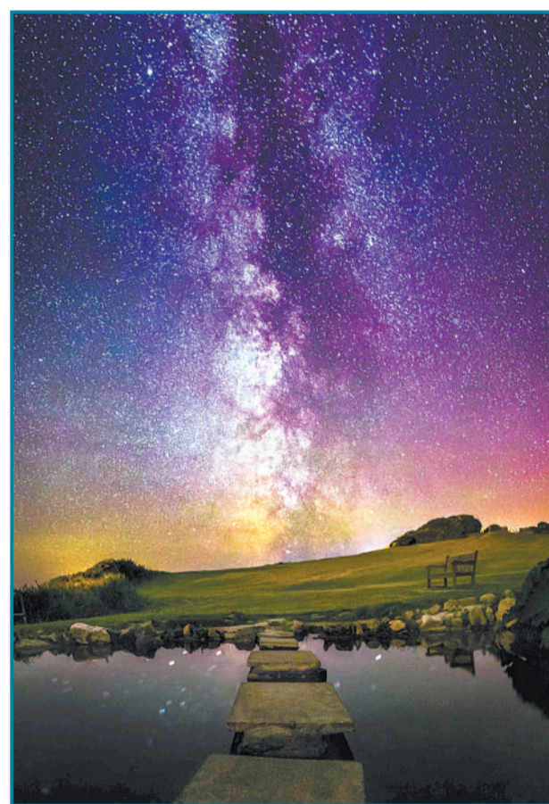
摄影师在英国怀特岛拍摄的夜空,星星看起来格外亮眼,月亮发出皎洁的光芒。