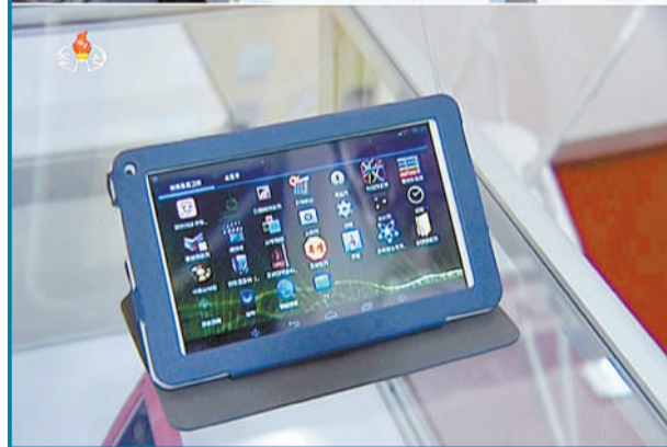
朝鲜在第十八届平壤春季国际商品展览会上公开了其自主研发的平板电脑。