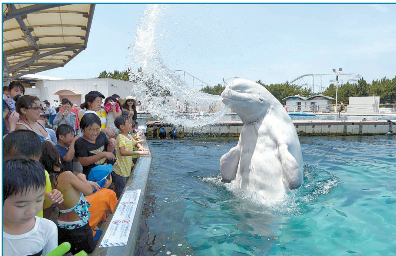
7月20日,日本横滨,当地的八景岛海洋乐园举办了一项特别活动,游客可以近距离观察珍稀物种“白鲸”,还可以感受到“白鲸喷泉”。