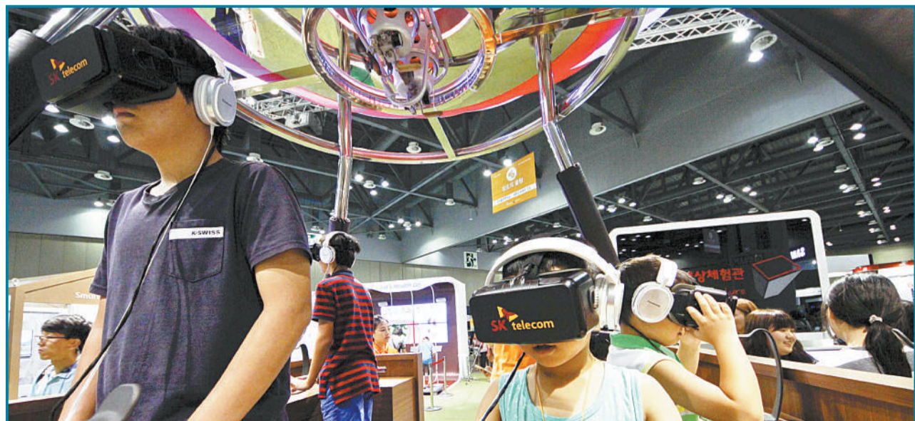
7月28日,韩国高阳,韩国科学节举办,参观者体验4D虚拟现实影像。