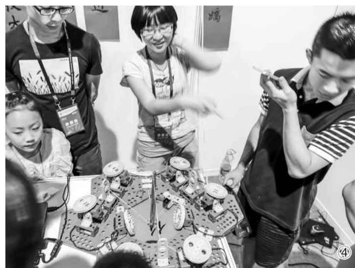
①纳米、农业等科技成果落户北京展示 ②观众现场体验新型交互动漫 ③“互联网+”正在让北京变得更“智慧” ④观众正在观看自动书法机器人表演