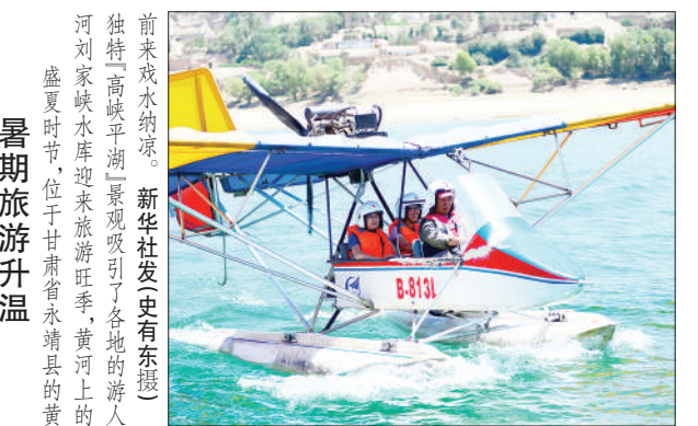
前来戏水纳凉。

独辟“高峡平湖”景观吸引了各地的游人。河刘家峡水库迎来旅游旺季,黄河上的盛夏时节,位于甘肃省永靖县的黄河刘家峡水库迎来旅游旺季,黄河上的盛夏时节,位于甘肃省永靖县的黄河刘家峡水库迎来旅游旺季,黄河上的盛夏时节,位于甘肃省永靖县的黄河刘家峡水库迎来旅游旺季。