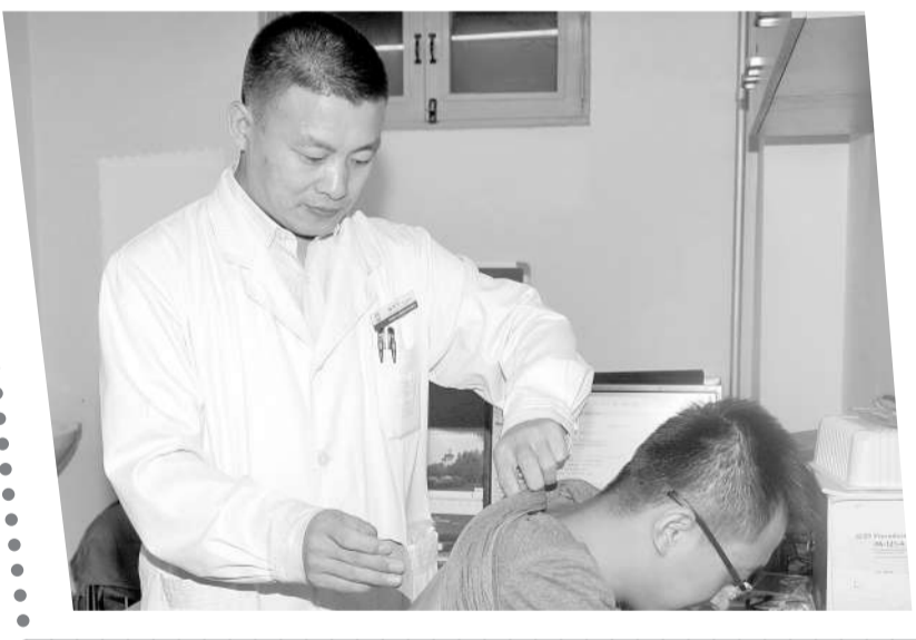
2015年北京佑安医院中医生物物理治疗科将继续承担冬病夏治穴位贴敷工作,成人及6个月以上儿童均可贴敷,医保病人不受医院选择限制,可根据病情及适应症报销。

刘飞透露,一般医院的“三伏贴”只有三贴,而302医院中西医结合肝病诊疗中心的“三伏贴”有五贴,增加了预贴和加强贴,目的是让补阳气的作用更强。