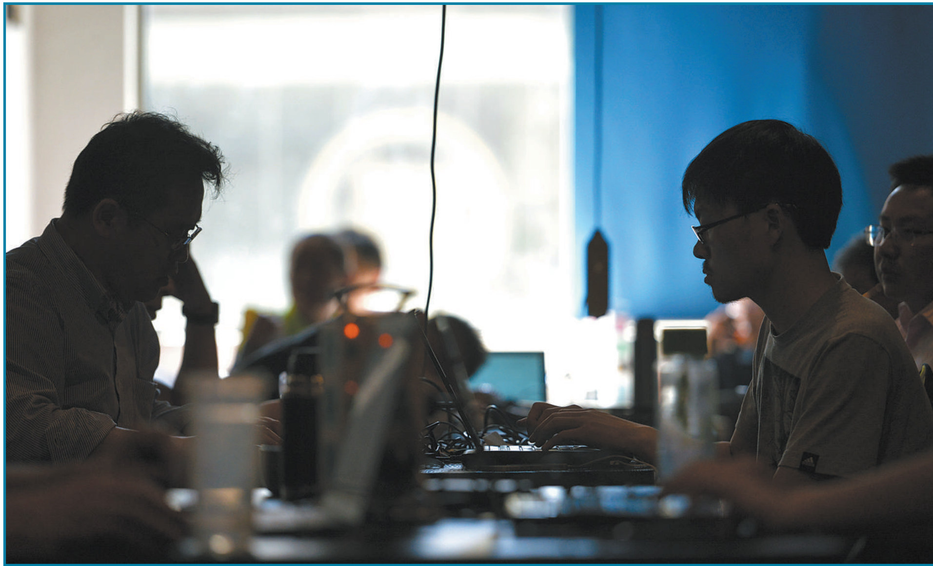
众多草根创业者聚集在“车库咖啡”，共同参与、分享创业的苦与乐，为自己的项目寻找投资方。