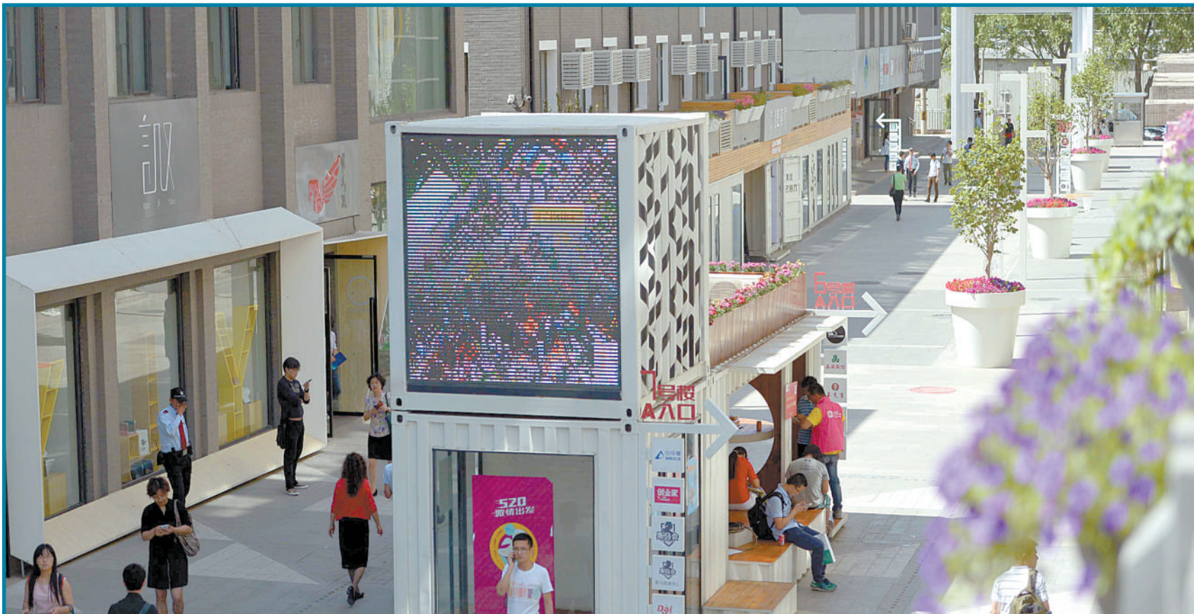
中关村创业大街是在北京市、海淀区政府共同指导下打造的我国第一条以创新创业为主题的特色街区，位于我国创新创业资源最为密集的中关村西区，是海淀区“一城三街”战略的重要组成。