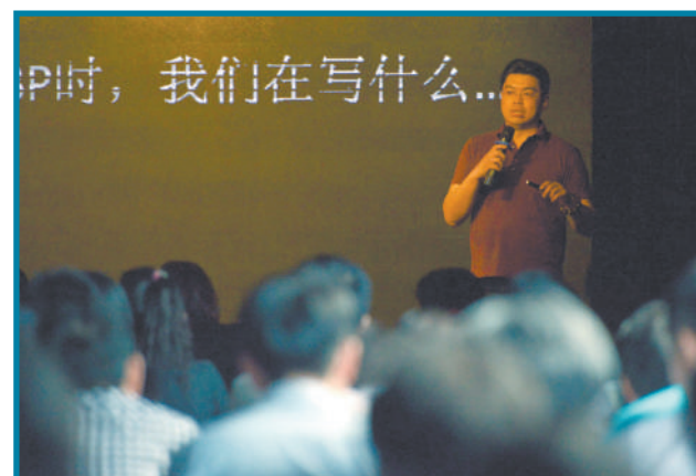
创业者在“黑马会”全球路演中心参加“移动互联网融资分享”沙龙活动。