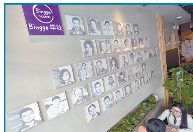
创业者在集天使投资、创业孵化、创业交流为一体的“Bingo咖啡”交流分享创业经验。