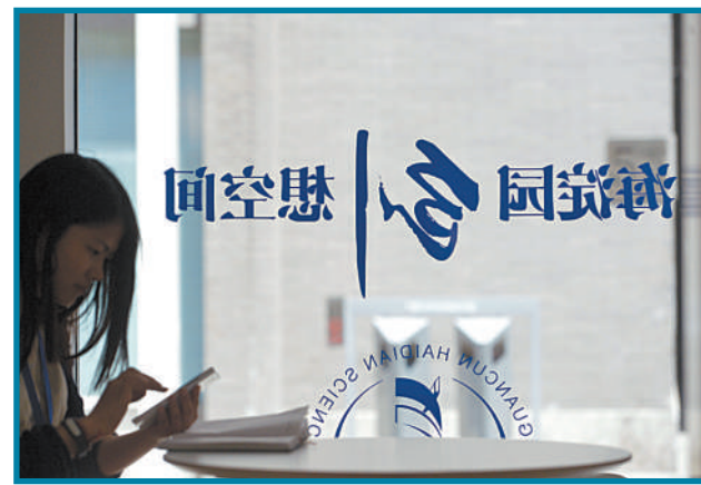
创业者来到创业会客厅，体验一站式创业服务。