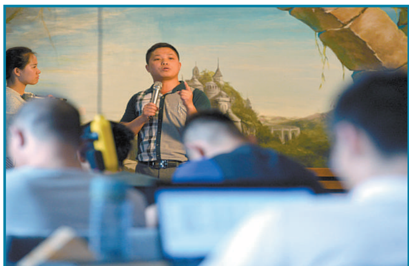
创业者在“午间半小时”活动上通过微路演宣传、分享自己的产品和创意。