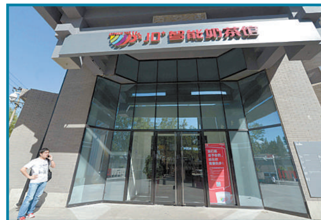
中国最大的自营式电商企业线下智能展示中心“JD+智能奶茶馆”。