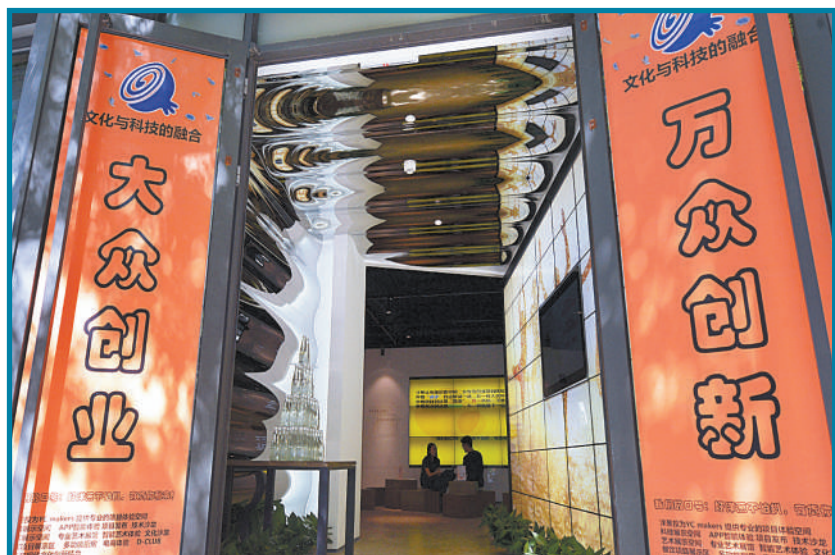
新入驻中关村创业大街的互联网及O2O创业项目展示平台“洋葱投”。