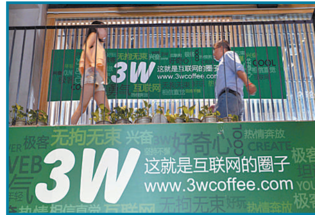
互联网领域的交流和创业孵化平台“3W咖啡”。