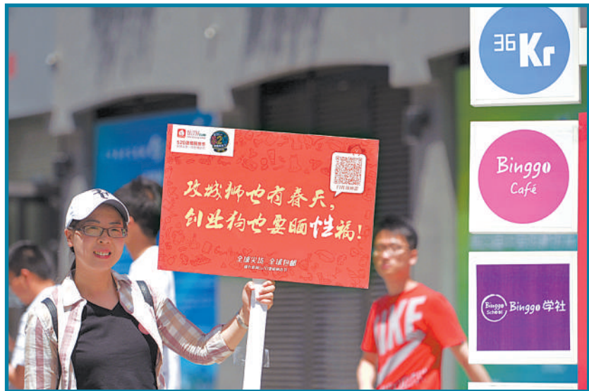
“蜜淘全球购”的青年创业者在中关村创业大街上进行产品宣传。