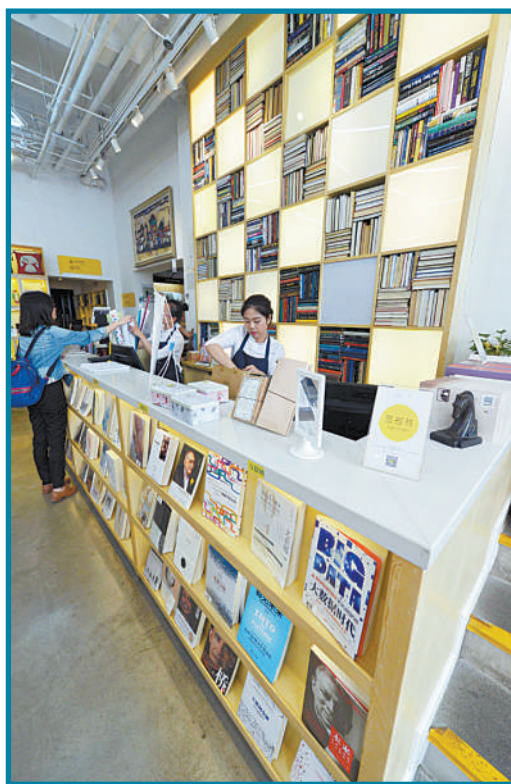
中关村创业大街上的“言几又”新式书店集图书、创意产品、休闲饮食于一身。