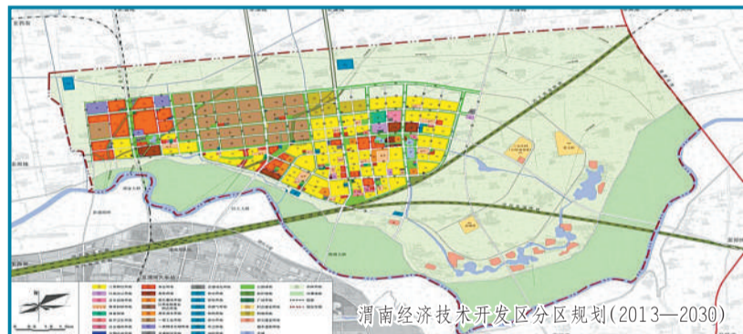
渭南经济技术开发区分区规划(2013—2030)