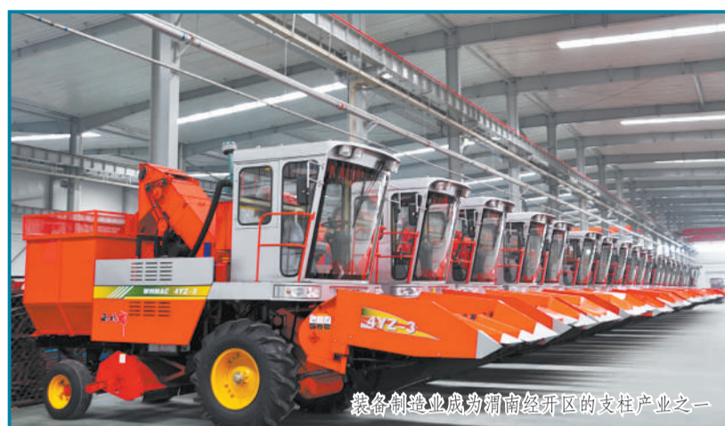
装备制造成为渭南经开区的支柱产业之一

三是强化服务意识，推行“马上就办”。渭南经开区庄重承诺：对所有入驻企业和项目，实行全程跟踪，并联审批，限时办结，我区主要领导亲自负责，以最大的诚意、最优的服务、最强的保障，让企业进得来，落得下，见效早，发展快。