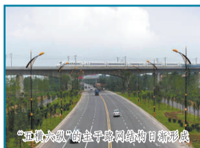
“五纵六横”的主干路网格局日新形成