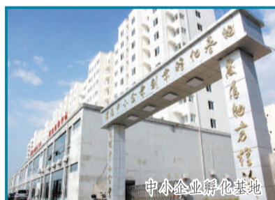
中小企业孵化基地