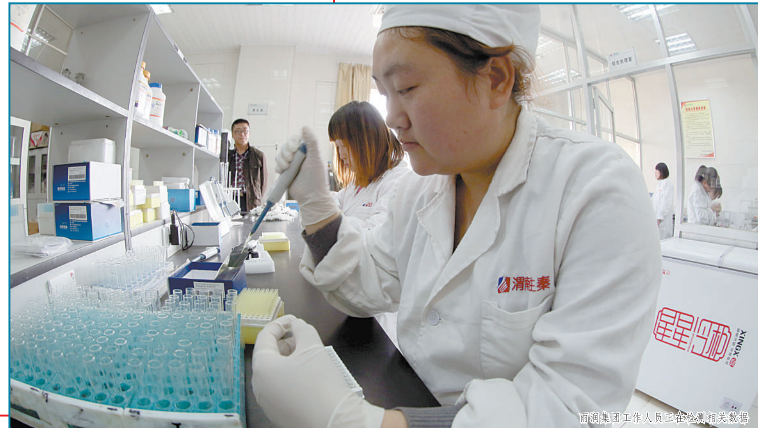
雨润集团工作人员正在检测相关数据