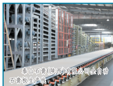
泰山石膏(陕西)有限公司全自动石膏板生产线