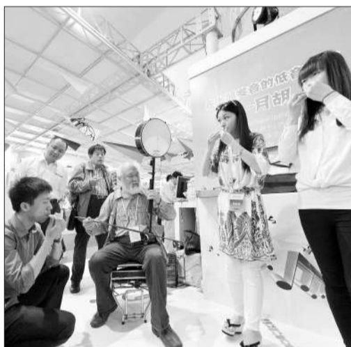
图为在上部发音的低音胡琴。