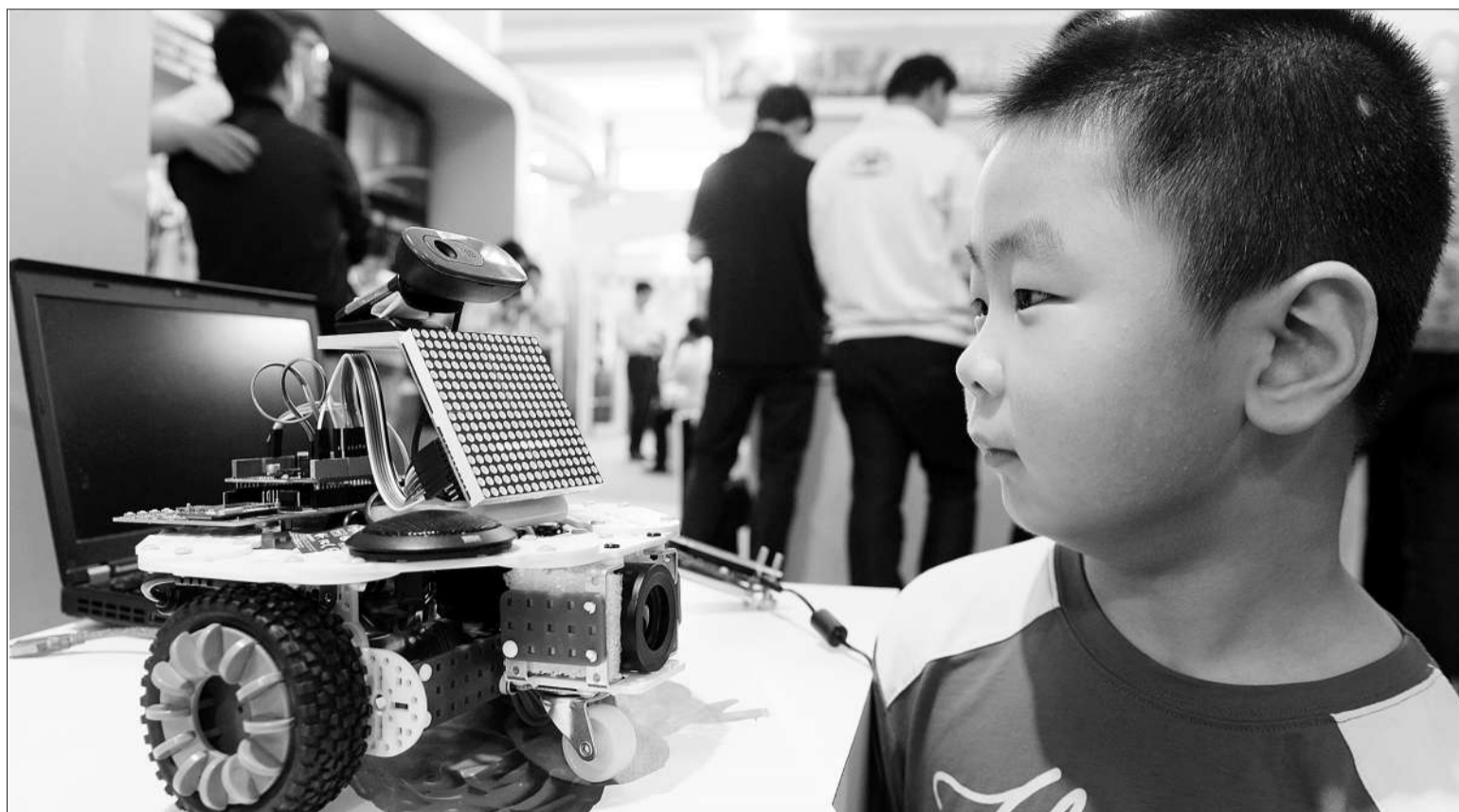
2015年全国科技活动周开展1800余项重点活动,包括众创空间、国际科普体验馆、创新创业者梦工厂等。图为教育领域中的机器人。