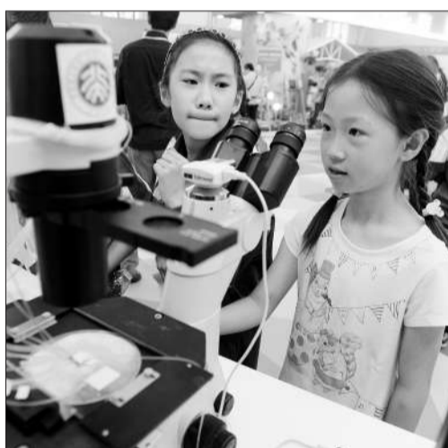
图为“大海捞针”带你找到单细胞。

山东 科技日报(记者魏东 王延斌 通讯员王锋)5月16日上午,2015年济南市科技活动周在天桥区“五一”广场正式启动。“爸爸快看,一转这个圆筒,里面的马就飞了起来,像动画电影一样。”5岁男孩儿琦琦在一个圆柱体的科技展品前迟迟不肯离去,对“会飞的马”表现出浓厚兴趣。值得一提的是,本届科技活动周还特别开设创业咨询区,邀请天使投资人、知名企业总裁现场为创业者答疑解惑,提供创业指导。