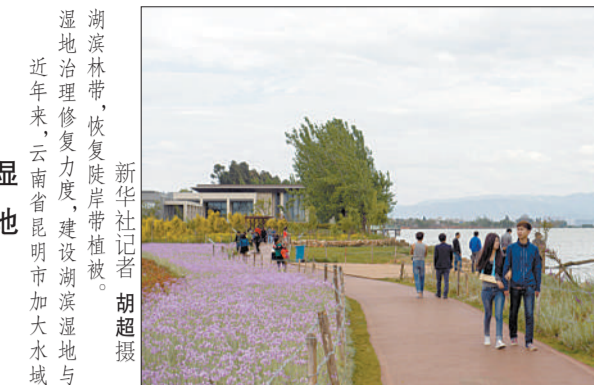
湖滨林带,恢复陡岸带植被。湿地治理修复力度,建设湖滨湿地与。近年来,云南省昆明市加大水城