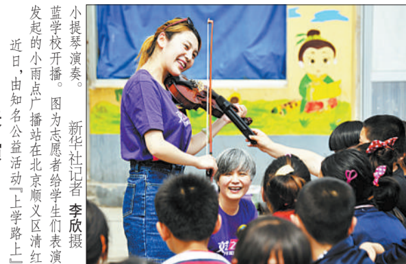
小提琴演奏。蓝学校开播。图为志愿者给学生表演。发起的小雨点广播站在北京顺义区清红。近日,由知名公益活动“上学路上”