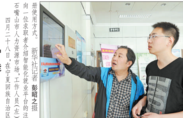
册使用方式。向一位求职者介绍智能化就业平台的注。石嘴山市人力资源市场,工作人员(左)四月二十八日,在宁夏回族自治区