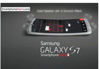
据韩国 inews24 报道,三星当前正在研发双摄像头技术,预计下一代的Galaxy S7手机上或出现双摄像头配置。

“地下水库利用巨大的采空区空间进行储水,利用采空区砾石对水体进行过滤净化,再利用自然压差进行供水,实现了井下供水、排水、污水处理、水害防治、环境保护的综合效益。”陈苏社说,仅大柳塔煤矿每年可节约用水约280万吨。此外,地下水库安装了在线监测系统,可对人工坝体进行24小时实时自动监测,保障安全可靠运行。