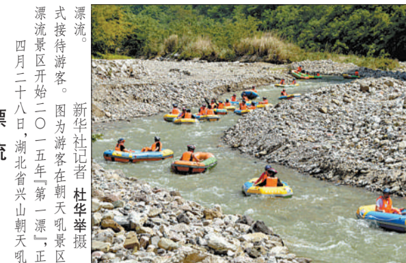
漂流。式接待游客。图为游客在朝天吼景区。漂流景区开始二〇一五年“第一漂”正。四月二十八日,湖北省兴山朝天吼