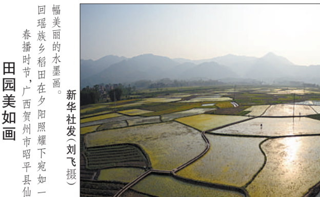
福美丽的水田。