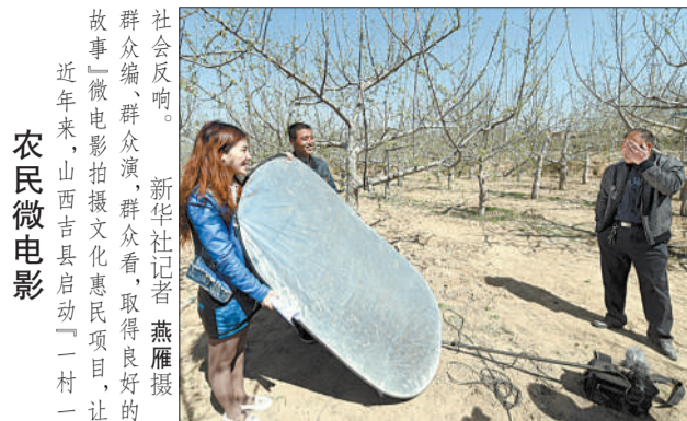
农民微电影 社会反响。