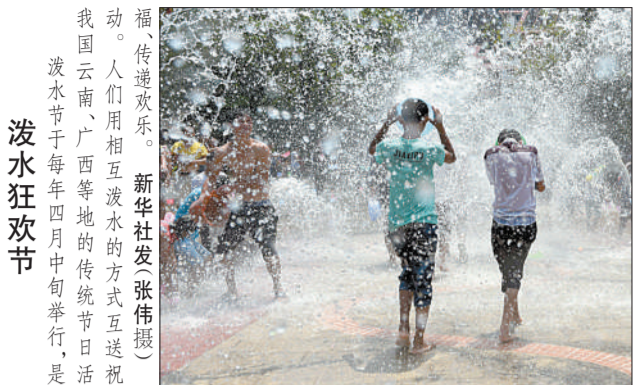
动。人们用相互泼水的方式互送祝福。