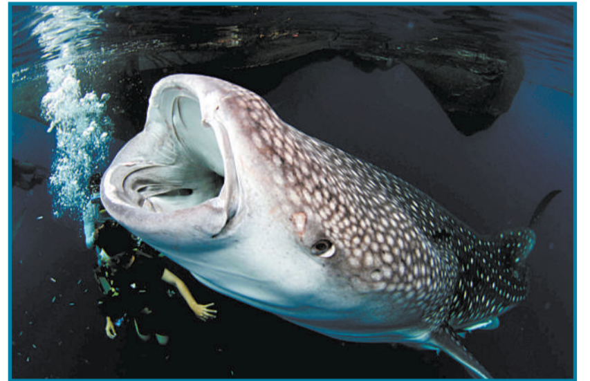
▼印尼那比雷,摄影师趁珍稀物种鲸鲨游到海面捕食时拍下的珍贵图片。