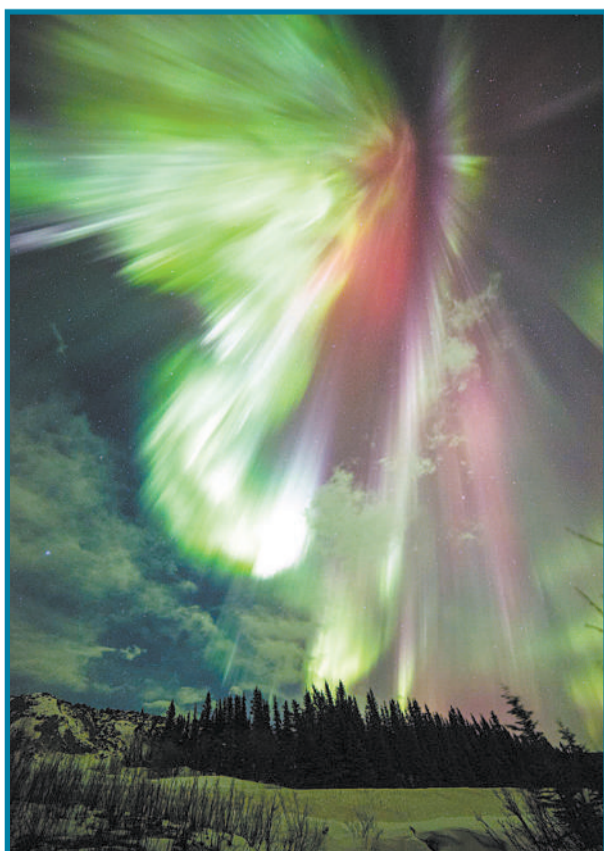
3月17日,强大的太阳风暴“击中”地球磁场。此次日冕物质抛射影响甚远,将北极光向南推进,给全球高纬度地区带来了一场极光盛宴。