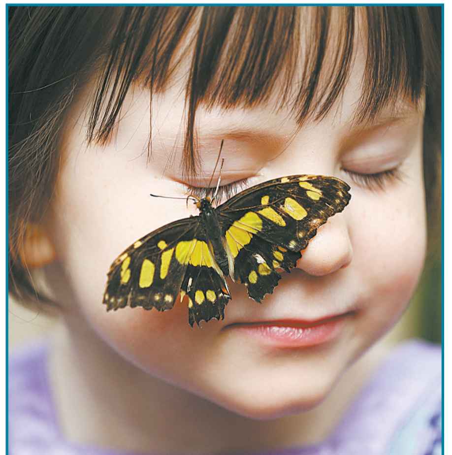
3月31日,英国伦敦,自然历史博物馆举办珍稀蝴蝶展预展。此次蝴蝶展从4月2日持续至9月13日。