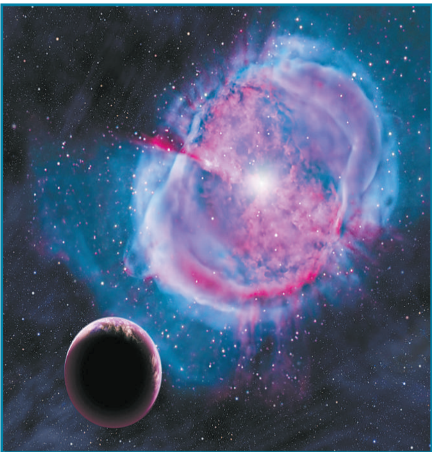
3月20日,艺术概念图展示了一个类似地球的行星环绕一个恒星而形成的“行星状星云”。开普勒太空望远镜近日发现了两颗最像地球的行星,被命名为开普勒-438b和开普勒-442b。