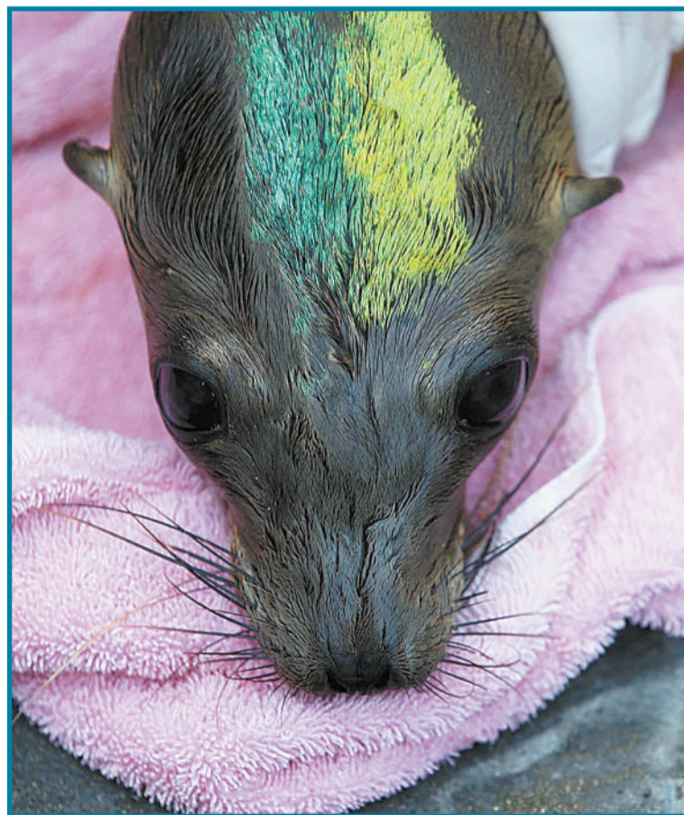
3月18日,美国加州,饥饿的海狮被冲上海岸,自2015年年初以来,已经有超过1800头奄奄一息的海狮被救援人员发现。专家认为,受厄尔尼诺现象影响,海狮面临食物短缺的困境。