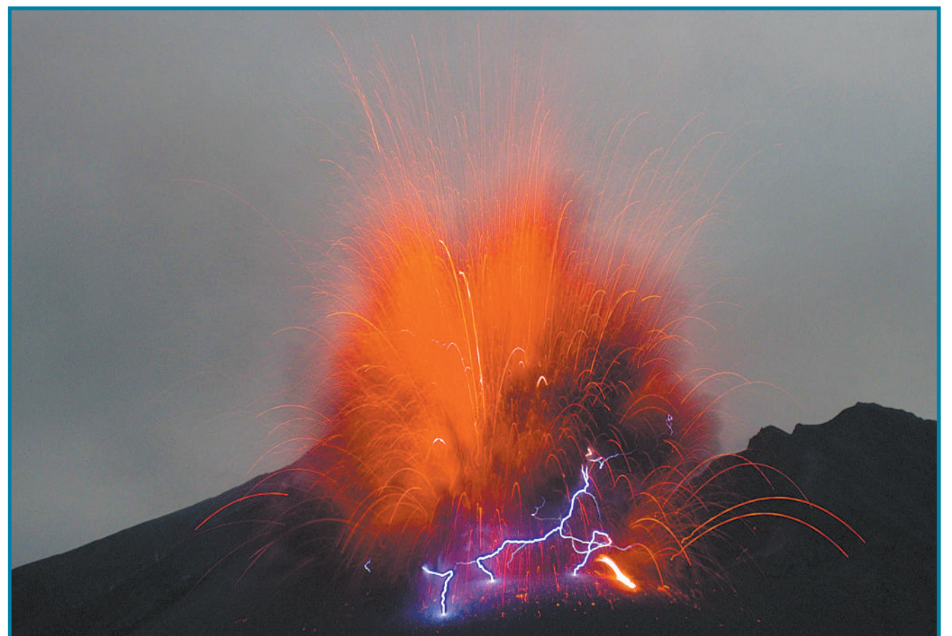
日本九州岛,德国摄影师拍摄的高度活跃的樱岛火山。摄影师捕捉到罕见的火山闪电现象和爆炸性冲击波席卷天空的壮观景象。