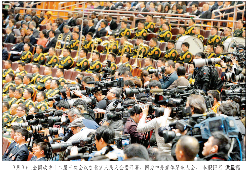
3月3日,全国政协十二届三次会议在北京人民大会堂开幕。图为中外媒体聚焦大会。本报记者 洪星摄

十二届全国人大三次会议举行预备会议 新华社北京3月3日电 3月4日上午,十二届全国人大三次会议举行预备会议,选举大会主席团和秘书长,表决会议议程草案。预备会议后,大会主席团举行第一次会议。11时,十二届全国人大三次会议举行新闻发布会,由大会发言人就大会议程和人大工作相关问题回答中外记者提问。全国政协十二届三次会议全天进行小组讨论,审议全国政协常委会工作报告和提案工作情况报告。