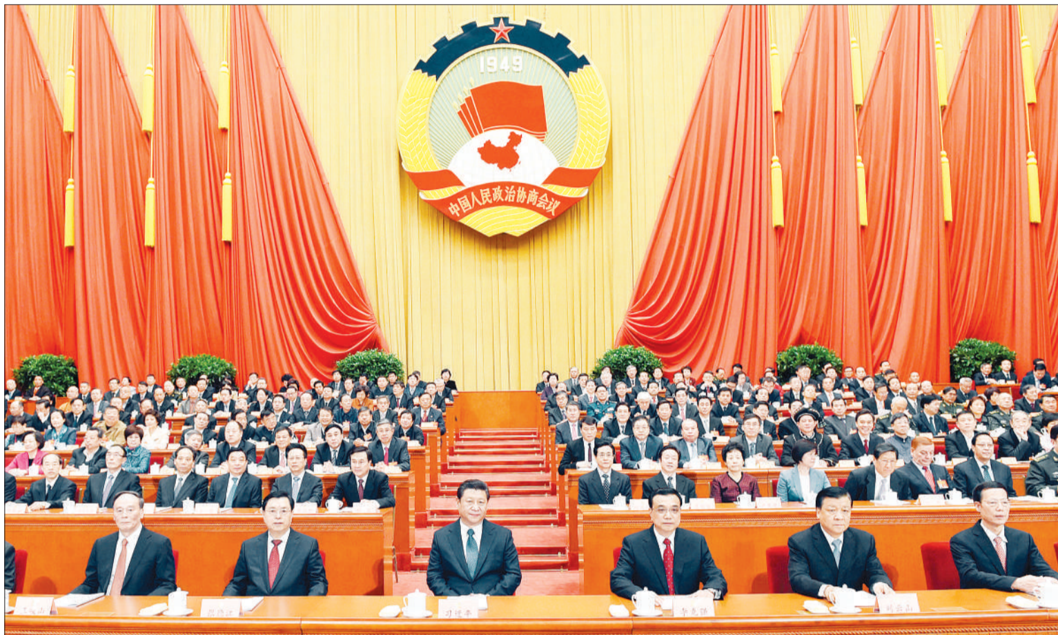
习近平、李克强、张德江、刘云山、王岐山、张高丽在主席台就座。

习近平李克强张德江刘云山王岐山张高丽到会祝贺 俞正声作政协常委会工作报告 齐续春作提案工作情况报告 杜青林主持