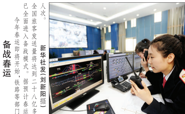
备战春运