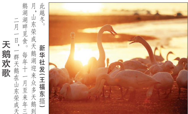
绿色莲藕