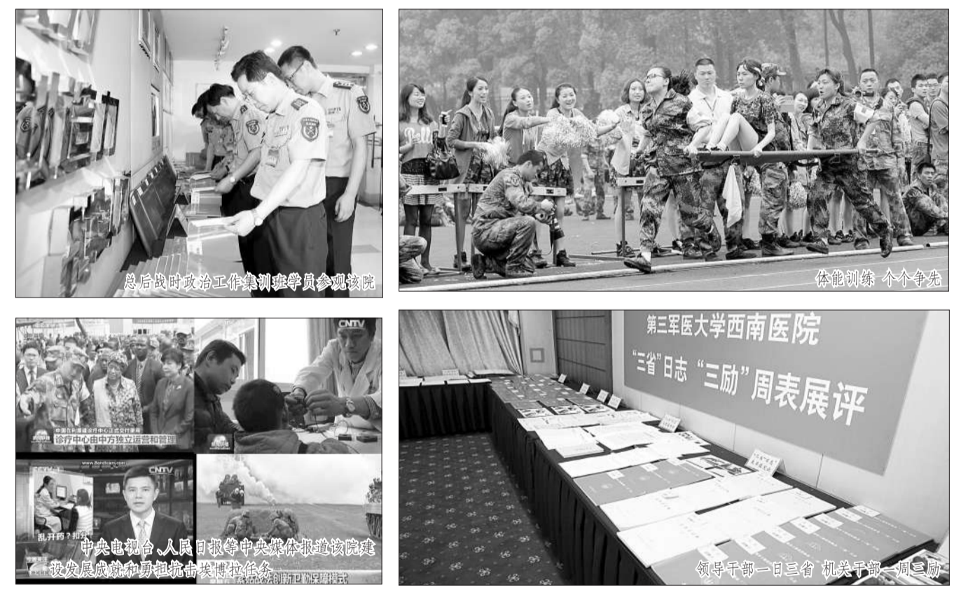
注重内涵引领校园文化浓郁芳香

●该院党委始终坚持文化兴院战略,大力弘扬红色军医文化,文化的品质和内涵,为医院建设发展营造良好的文化氛围,奠定牢固的文化根基。