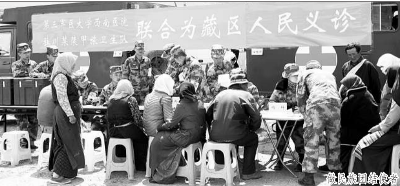
为驻地部队官兵义诊