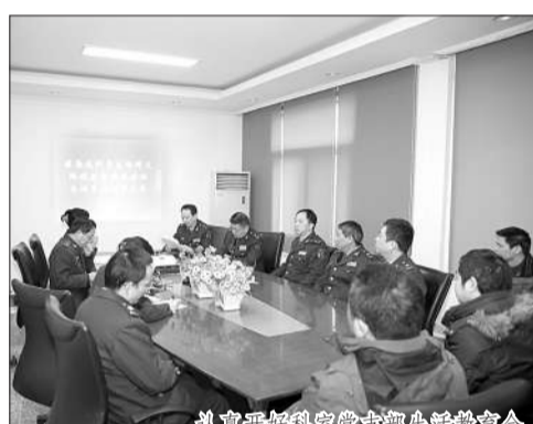
扎实开展院党委专题民主生活会

该院作为总后群众路线教育实践活动联系点,总后勤部副部长秦银河中将两次率工作组亲临指导,出席医院教育实践活动党员干部大会,指导召开院党委专题民主生活会,称赞西南医院教育实践活动早、行动快、措施实,联系点成了示范点。