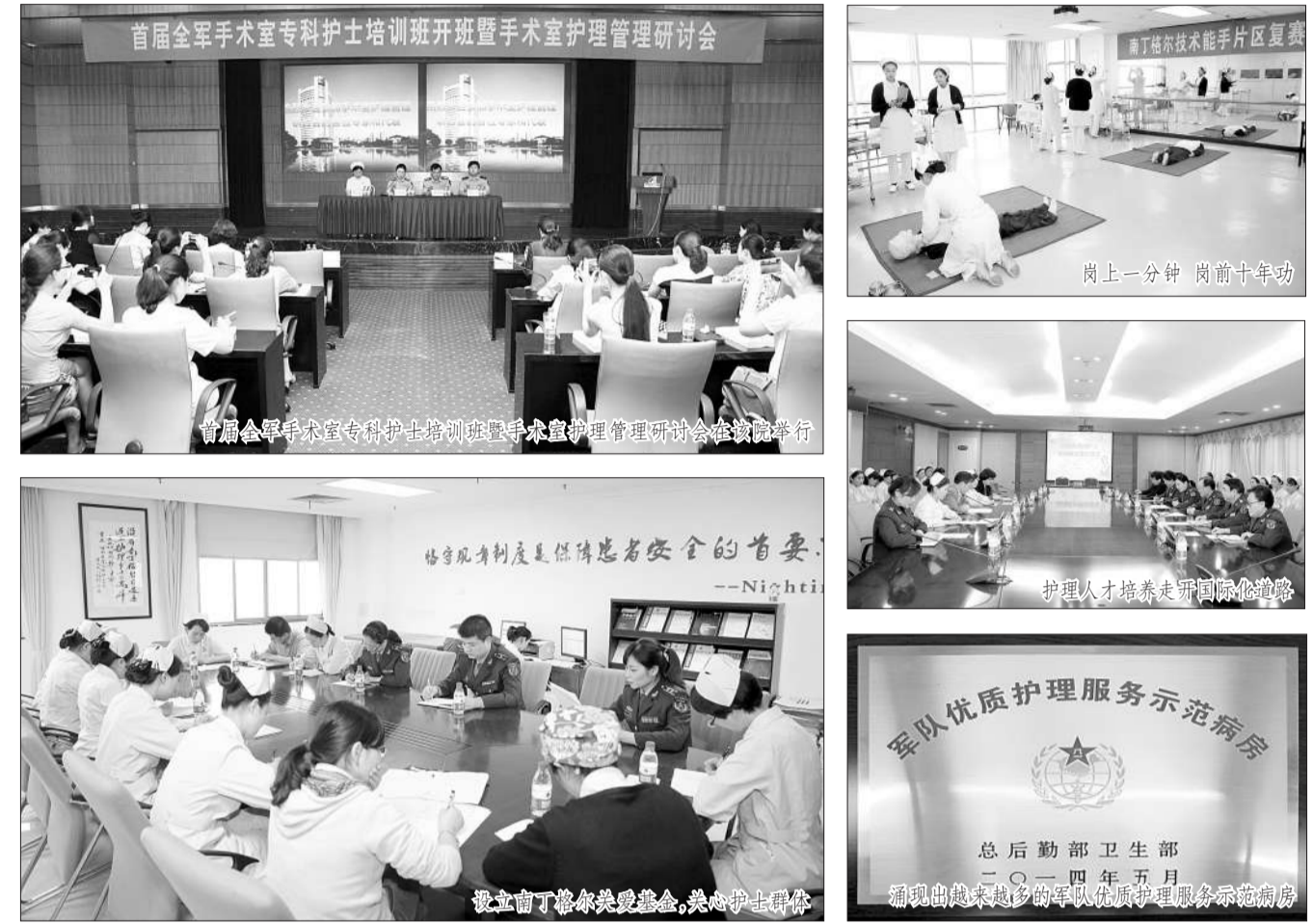
南丁格尔关爱基金助力护理工作创新发展

●建设研究型医院,必须打造研究型护理。该院党委坚持南丁格尔精神,打造一支倾心患者、服务一流,具有国际一流水平的护理队伍。