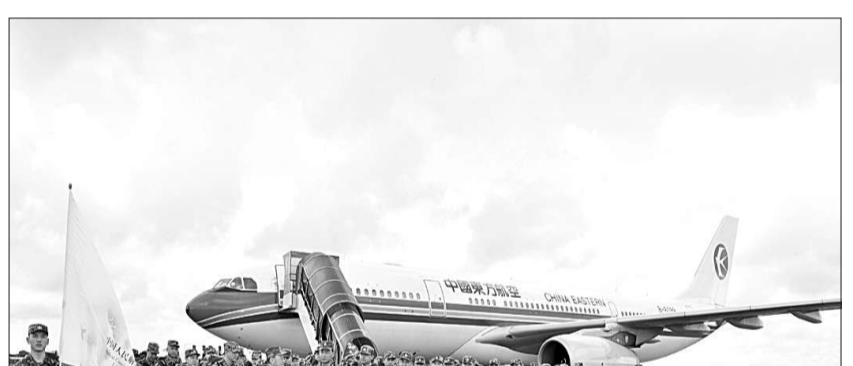
中国人民解放军援利医疗队出征仪式在总后勤部举行

●根据中央军委命令,以该院为主抽组中国人民解放军援利医疗队。院党委高度重视,专题召开常委会,机关加班加点编制计划,全体人员踊跃参