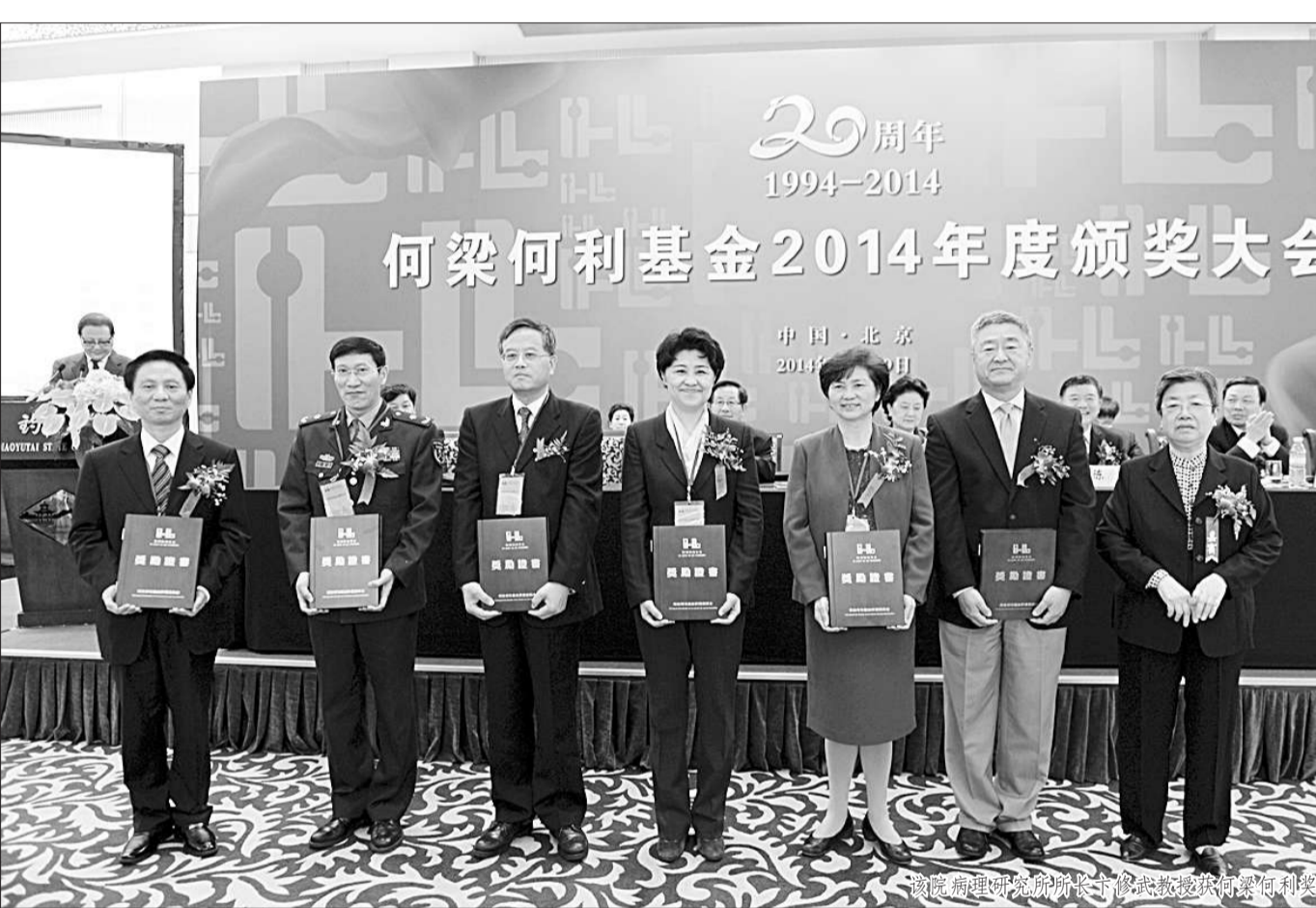
何梁何利基金2014年度颁奖大会

●该院党委紧盯“建设跻身世界一流名院方阵的研究型医院”宏伟目标,建设研究型党委,打造研究型机关,培育研究型人才,遴选研究型学科,提倡研究型工作,医院全面建设全面过硬,各项工作全线飘红。