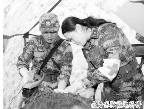
全力保障驻地官兵