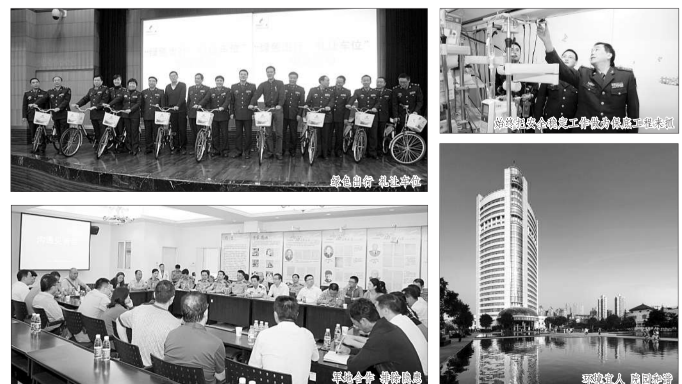
制度建设促进行政后勤规范高效

●该院党委以“生态营区”创建成果为契机,持续加强“绿化、亮化、美化、人文化”建设,倡导“绿色出行、礼让车位”疏堵堵堵,扎实推进清房、院内部审计阳光工程,顺利通过“两项普查”实地核查验收。紧盯安全处置立体化、安全预案模块化、安全奖惩绩效化的工作格局,顺利实现重点人员、重点部位、重点时段,坚持防、管、控、评、改、建“六位一体”的工作目标,确保了该院的安全稳定和高度集中统一。