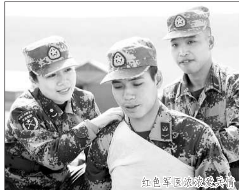
红色军医志愿服务

●该院党委牢记军委总部“向实战聚焦,向部队靠拢”的总体部署,强势推出“强军工程”,着力提高训练实战化水平,多次参加卫勤建设高