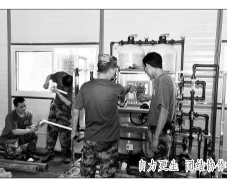
全力攻坚 加班加点