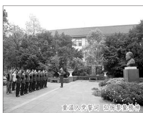
走进入党誓词 弘扬奉献精神

●西南医院党委紧紧围绕“为民务实清廉”的主题,严格按照“照镜子、正衣冠、洗洗澡、治治病”总要求,团结带领各级党组织和广大党员认真学习主席系列重要讲话精神,全面贯彻军委、总后和学校党委