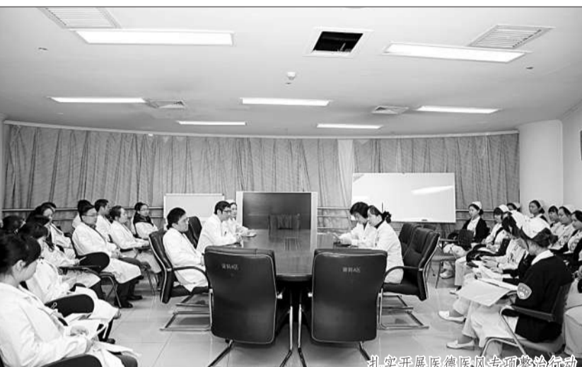
扎实开展院党委专题民主生活会