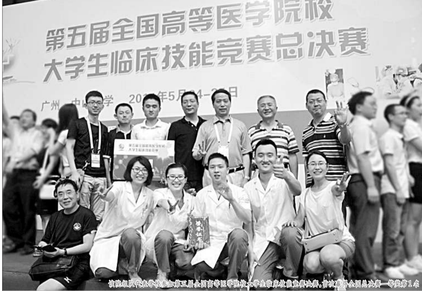
第五届全国高等医学院校大学生临床技能竞赛总决赛

●该院党委坚持“以质量取胜、以特色取胜”的办学思路,按照“实施一流发展战略,建设世界医学名校”的指示要求,创新教育教学方法,提升师资队伍水平,转变人才培养模式,建立引导学管联系,教育训练工作不断取得新成绩、实现新突破。