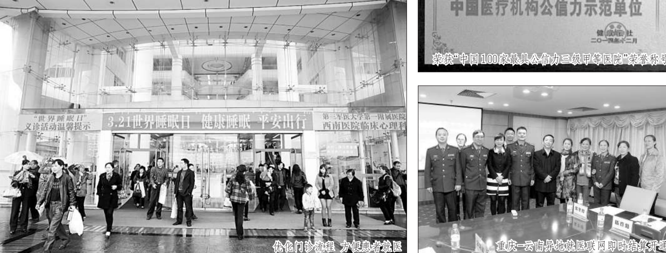
中国百姓放心百佳示范医院